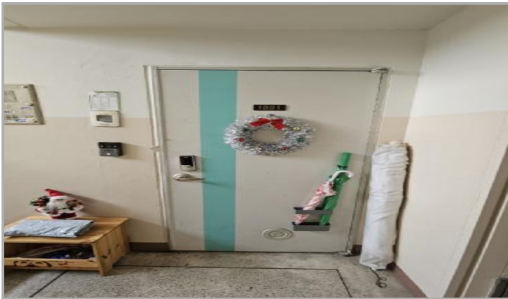
본건 호 전경