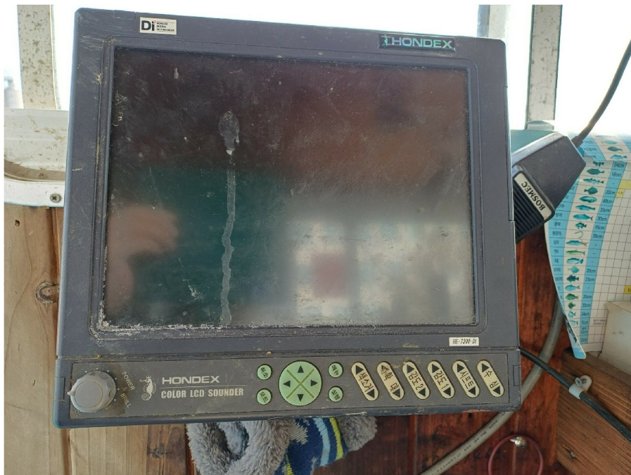
4) - Col or LCD Sounder