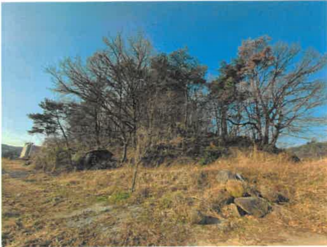
본건 일부 전경