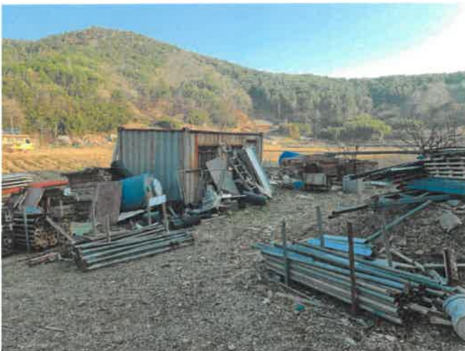
본건 일부 전경