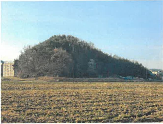
본건 및 주위 전경