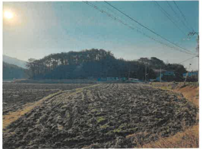
본건 및 주위 전경