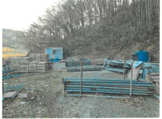
본건 일부 전경