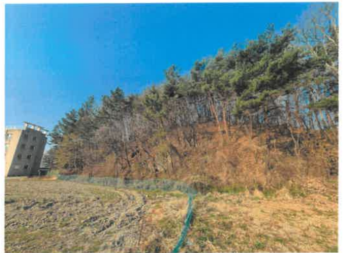
본건 일부 전경