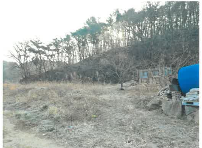
본건 일부 전경