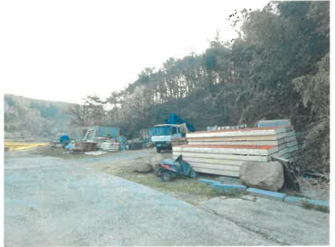
본건 일부 전경