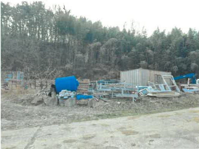
본건 일부 전경