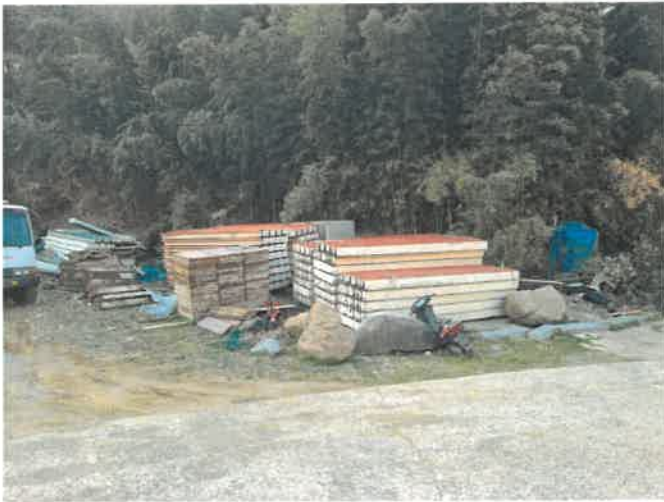
본건 일부 전경