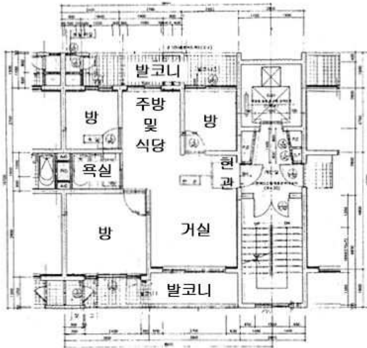
< 내부 구조도 >

※ 본건 건물개황은 점유자의 폐문부재로 인하여 관련공부름 토대로 표준적 이용상황 및 현지조사사항을 참조하였으며, 임대관계는 미상임.