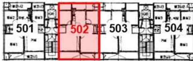
< 호별 배치도 >