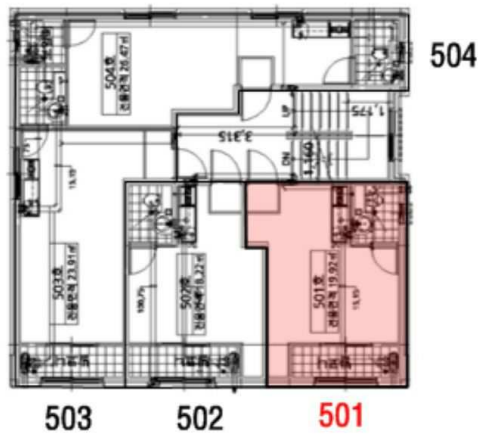
< 내부구조도 >