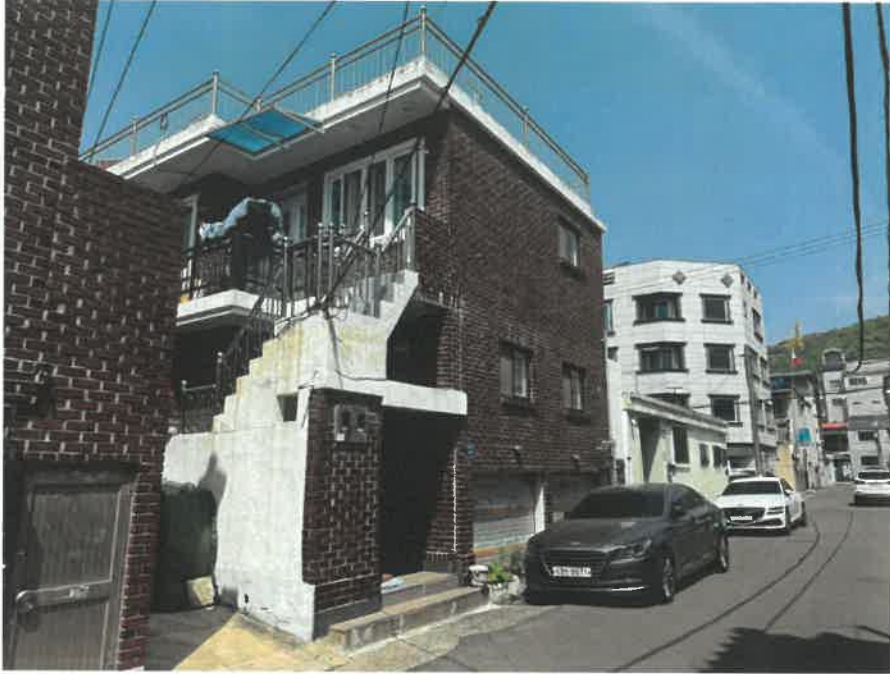
본건 토지 건물 전경