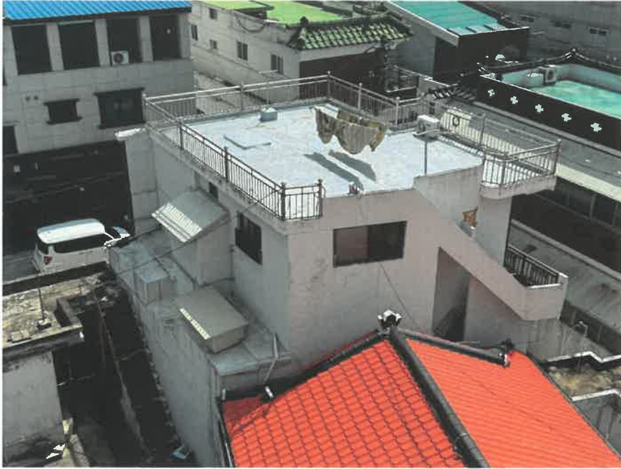
본건 건물 전경