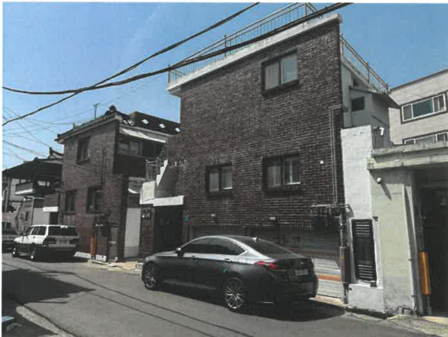
본건 건물 전경