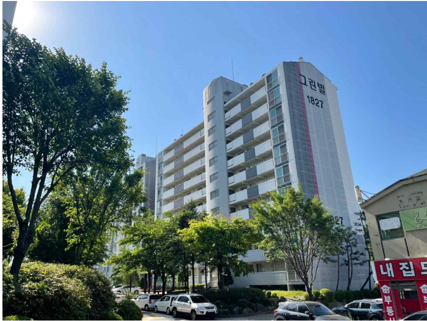
대상물건을 포함한 전경모습