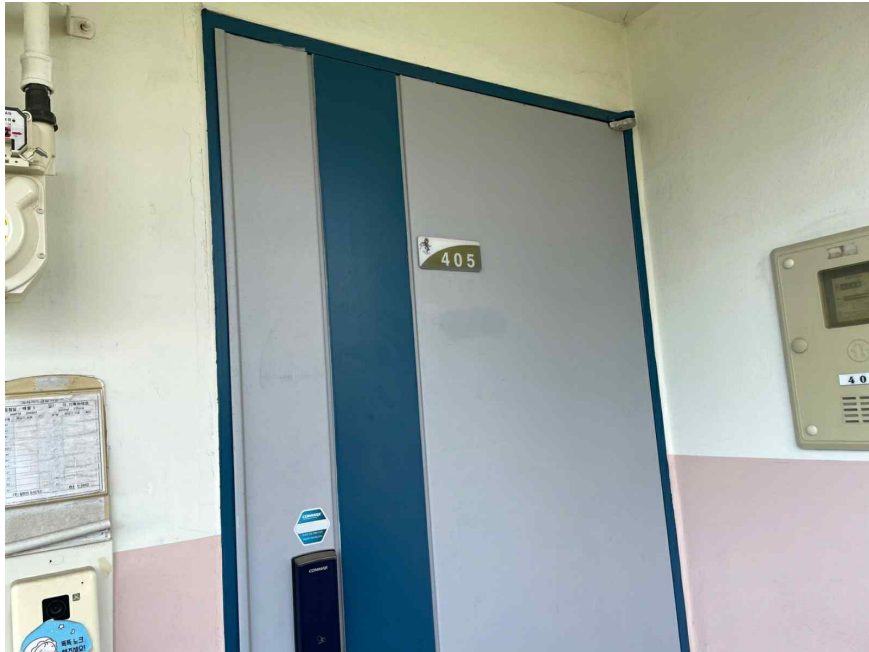
일련번호(1) 출입구 모습