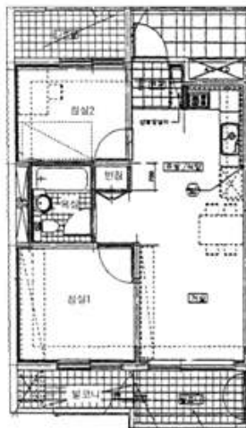
【 (1) 제4층 제405호 】