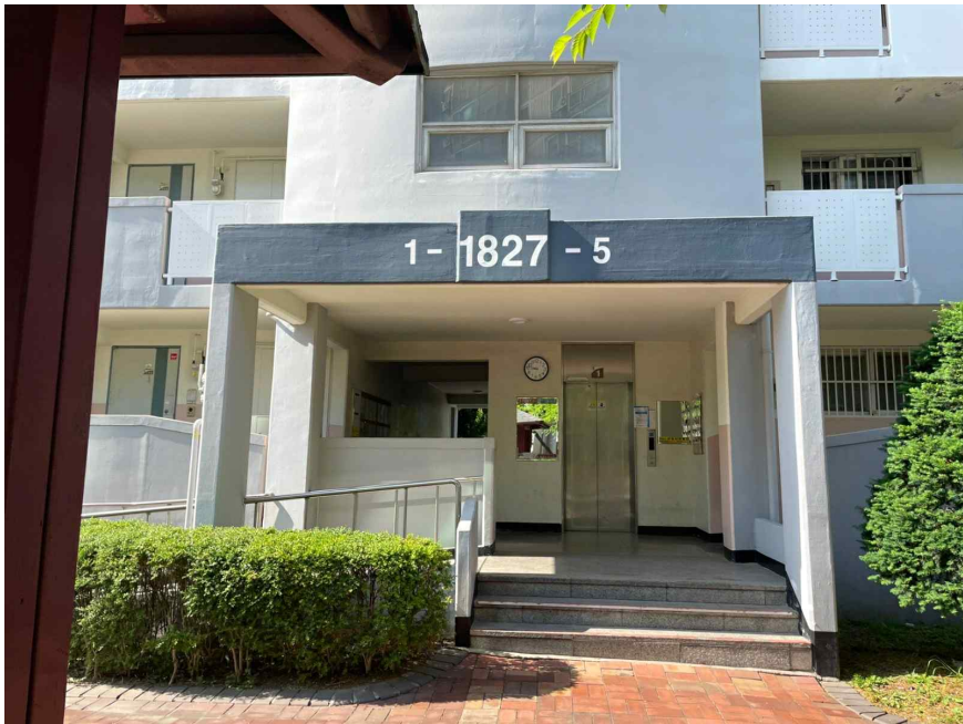
일련번호(1) 1층 주출입구 모습