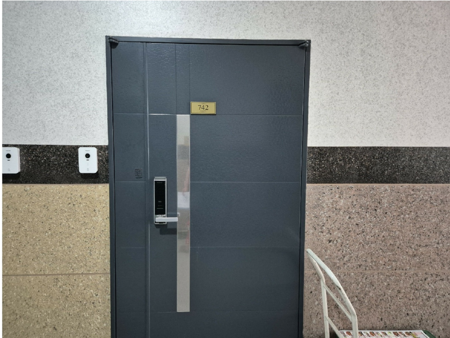
1- 7 742