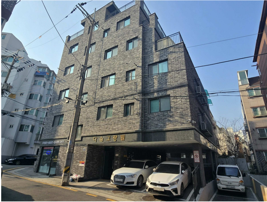
본건 전경 (본건 남동측에서 촬영)