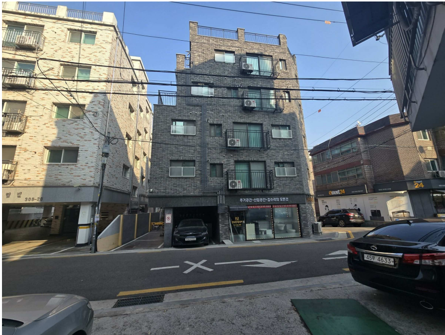
본건 전경 '(본건 남서측에서 촬영)