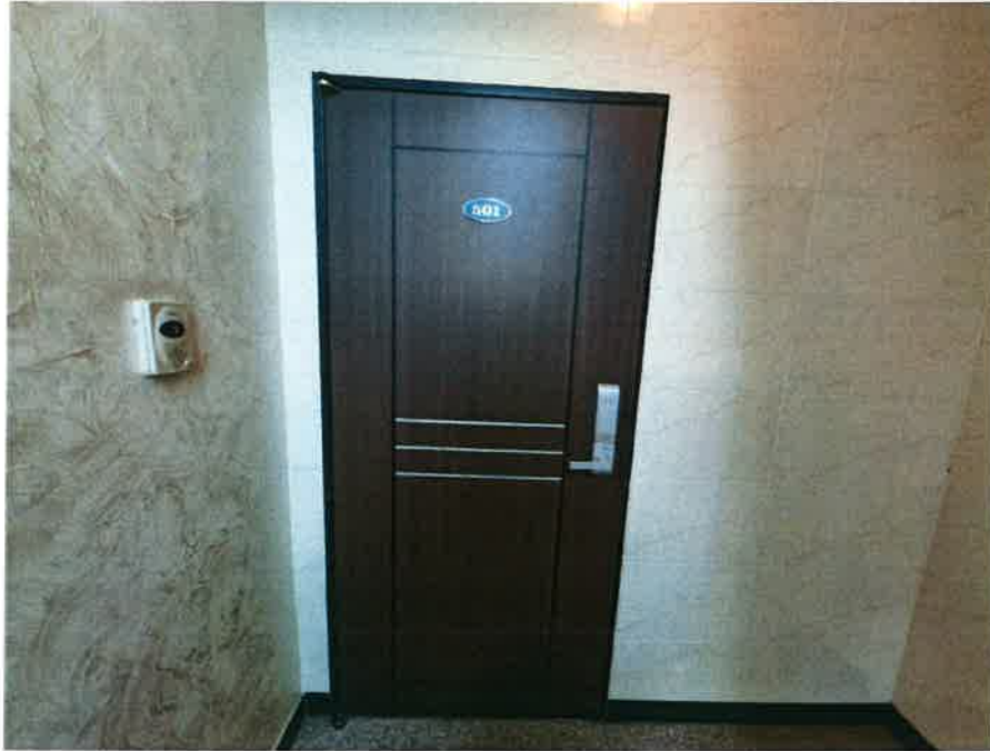
본건 현관문 전경