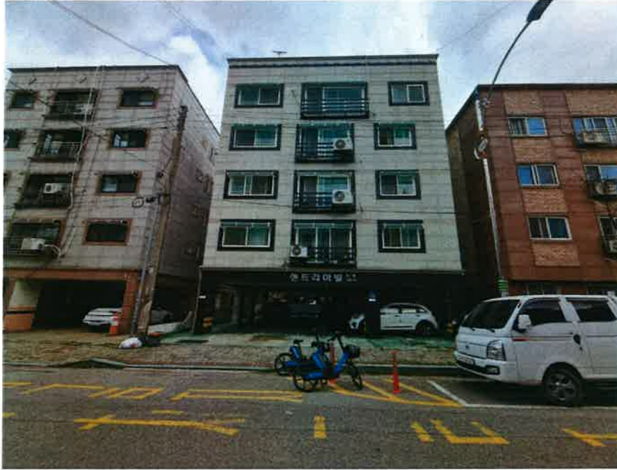
본 건 전 경