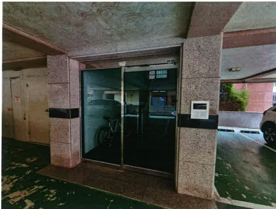
본 건 출입문 전 경