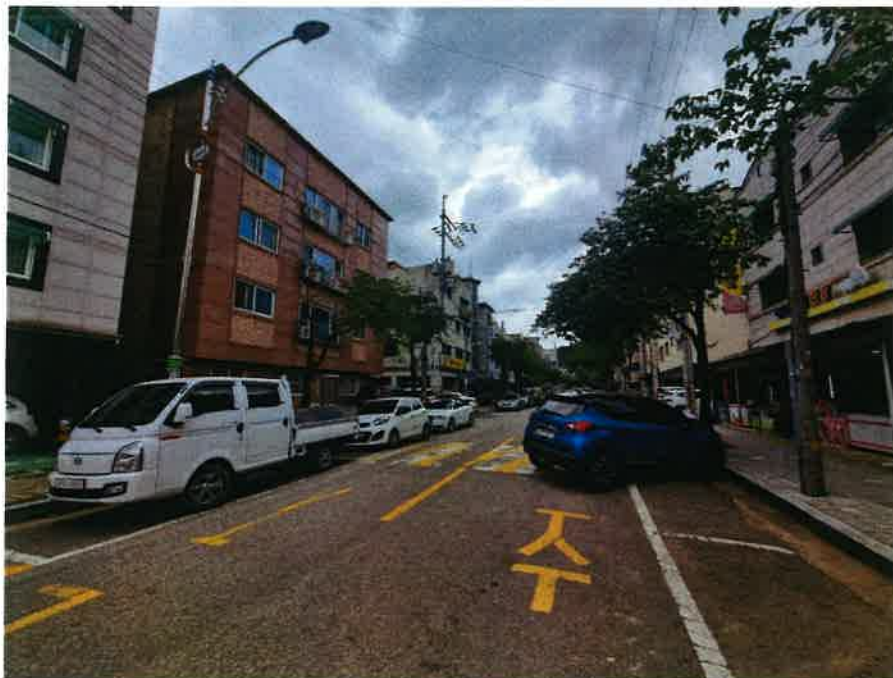
본건 접면도로 전경