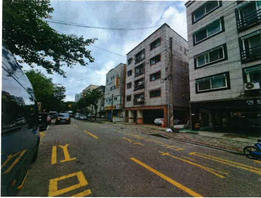
본건 접면도로 전경