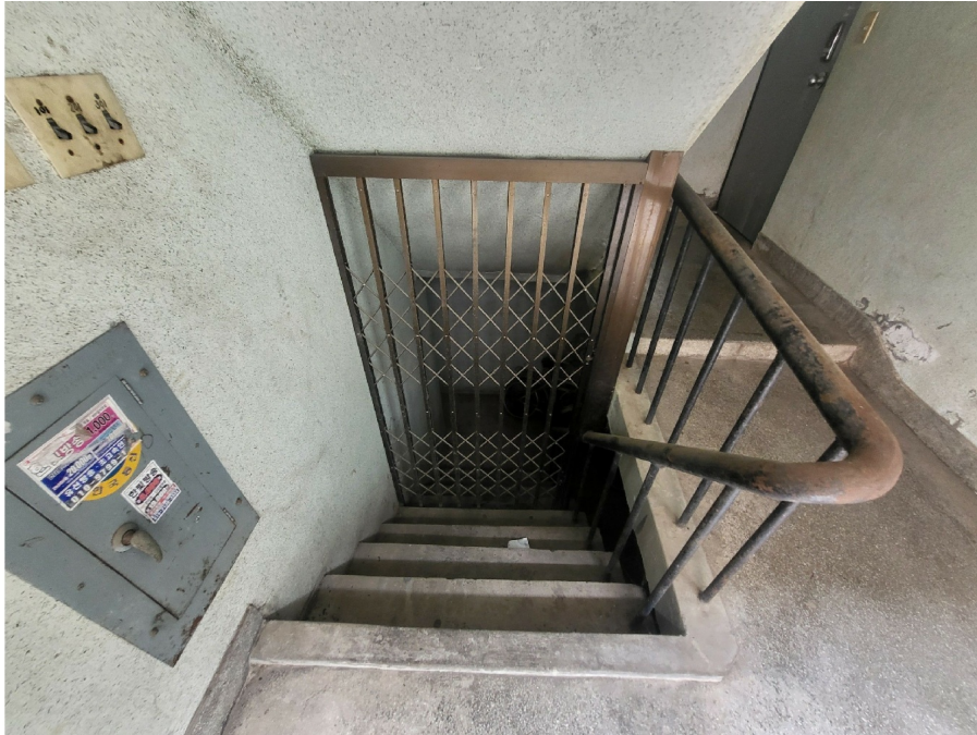
( 6 )