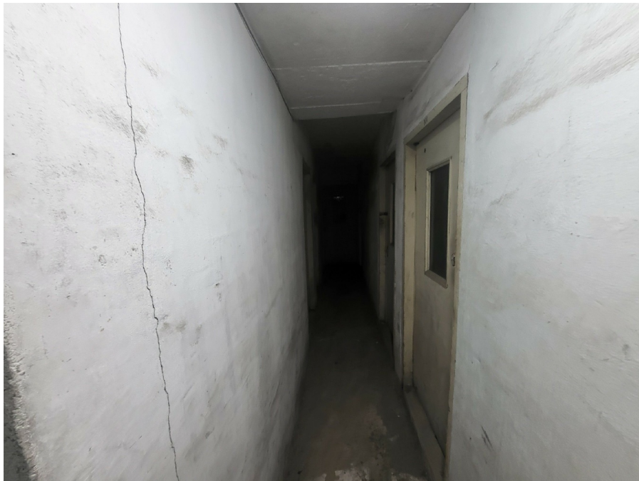
( 6 )