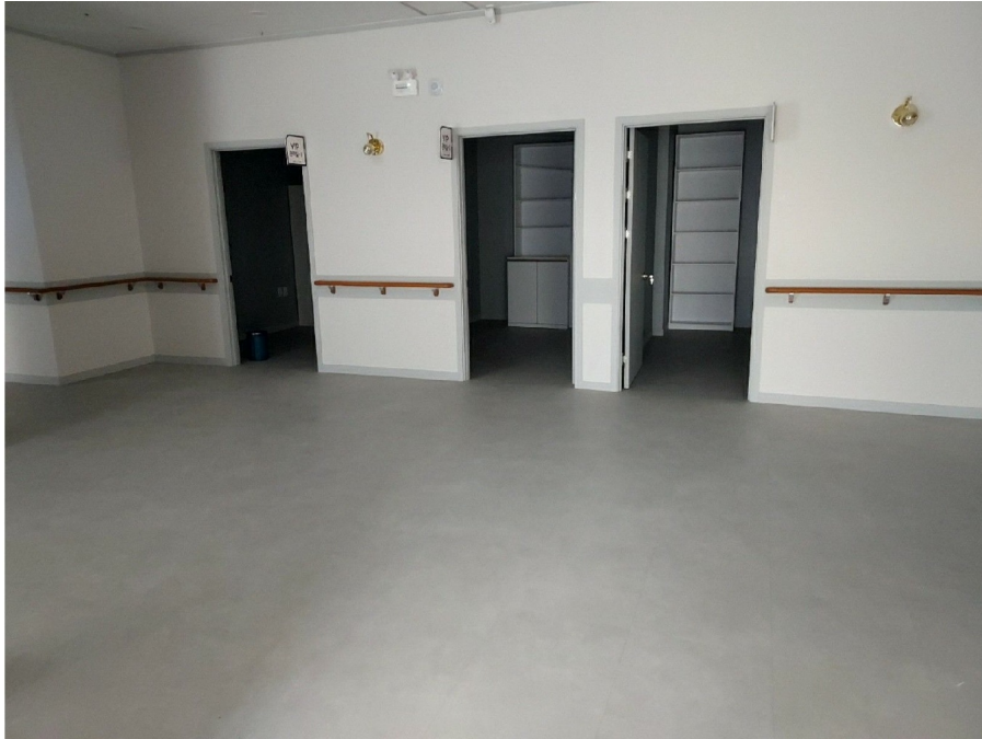
3 303 (