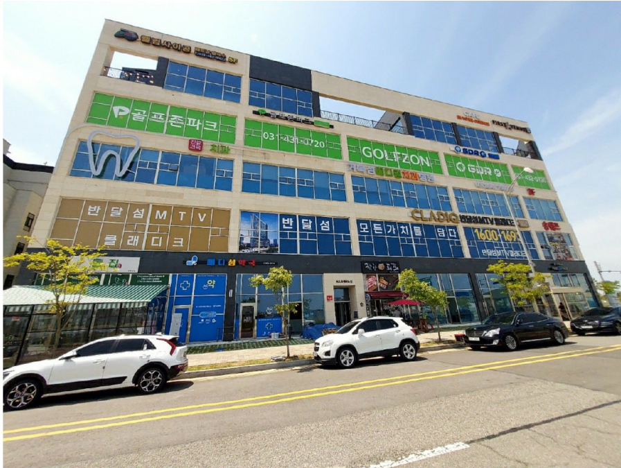
( 2 )