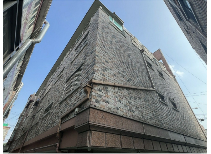
( ) ( )