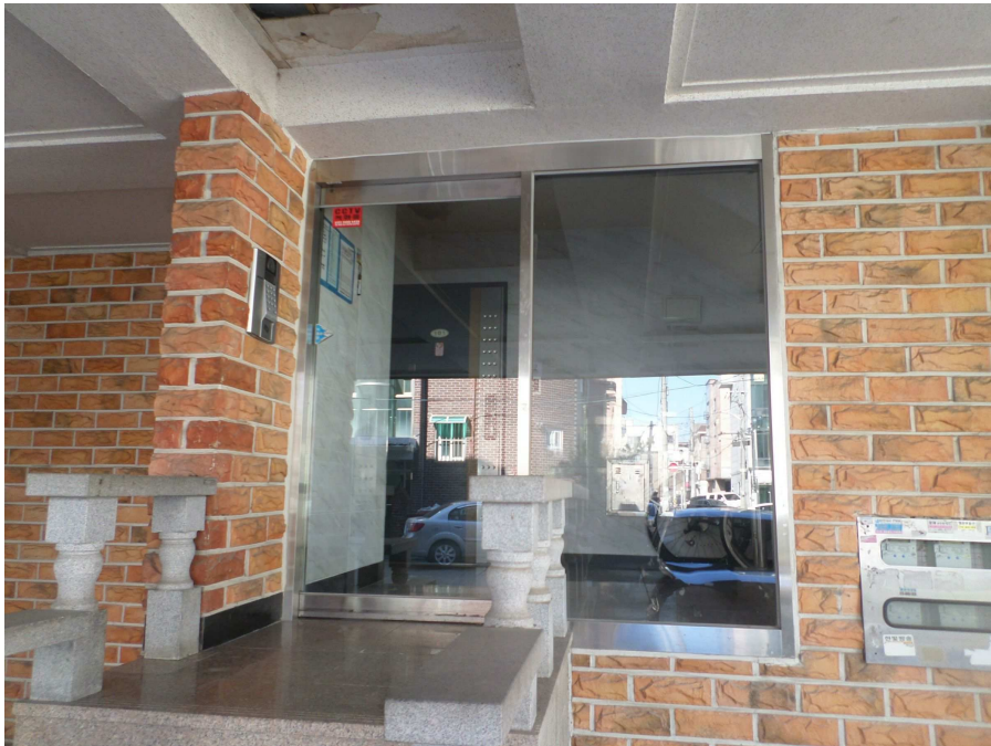
본건 건물 입구부분