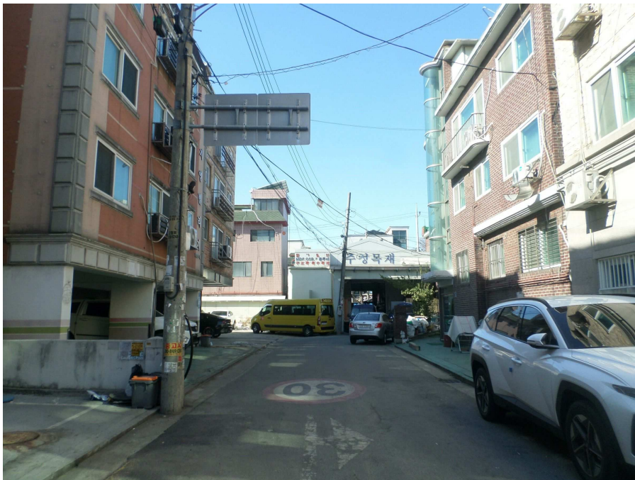
본건 북측 도로변 주위환경