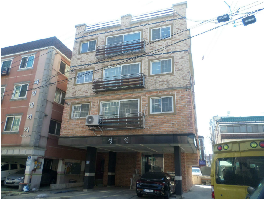
본건 외부전경 (북측에서 촬영)