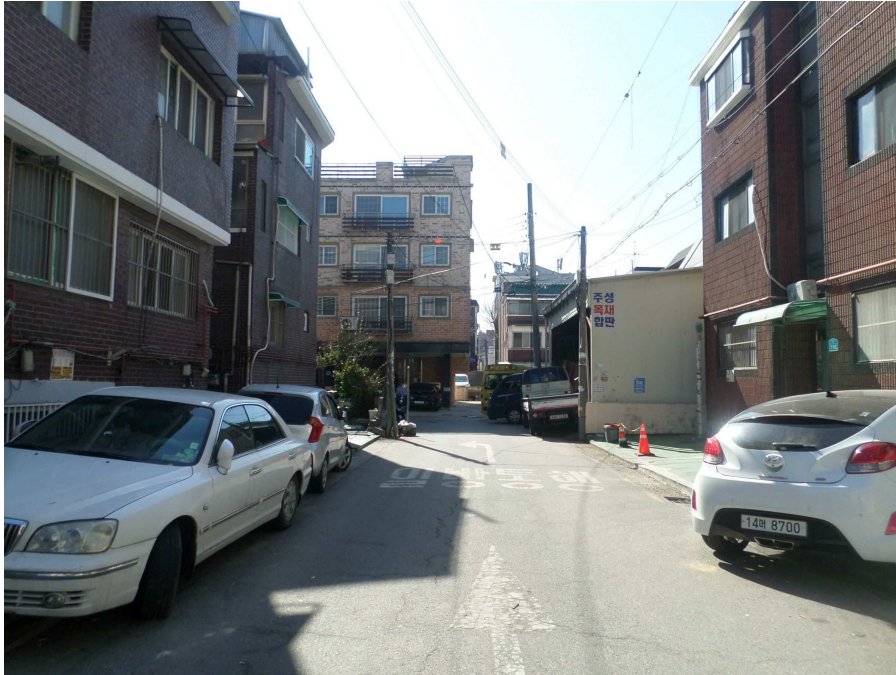
본건 북측 도로변 주위환경