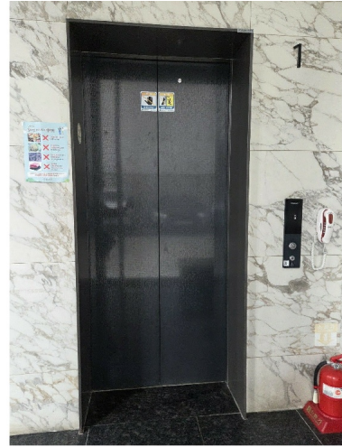
( 901 )