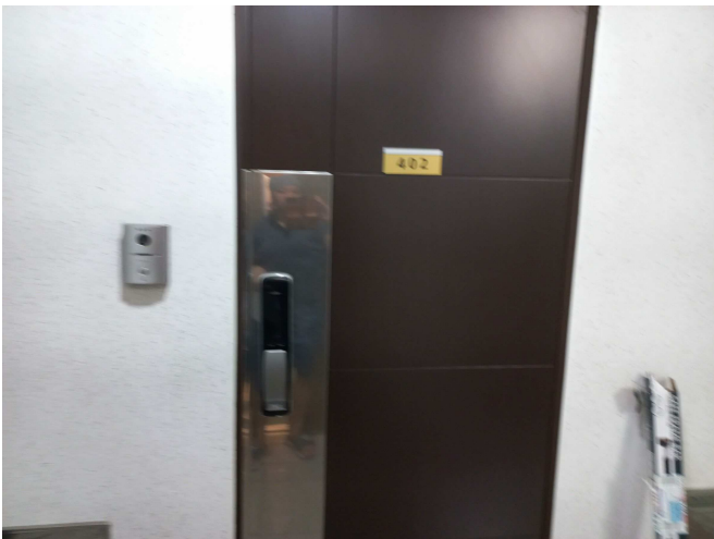
본건 호 출입구