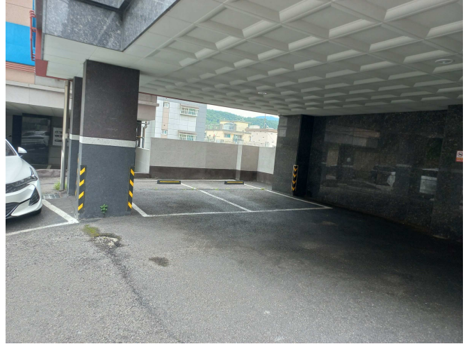
본건 건물 주차장