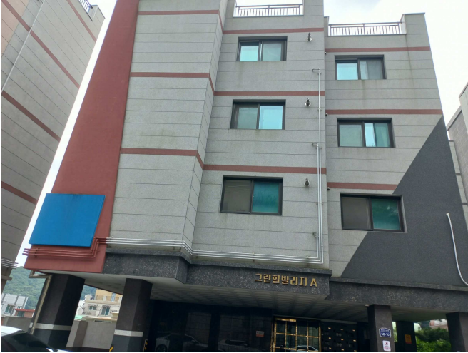
본건이 소재하는 건물