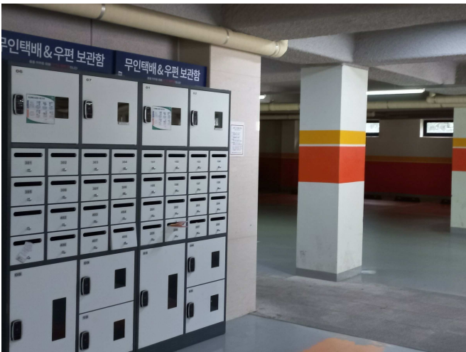
본 건물 1층 주차장 및 무인보관함