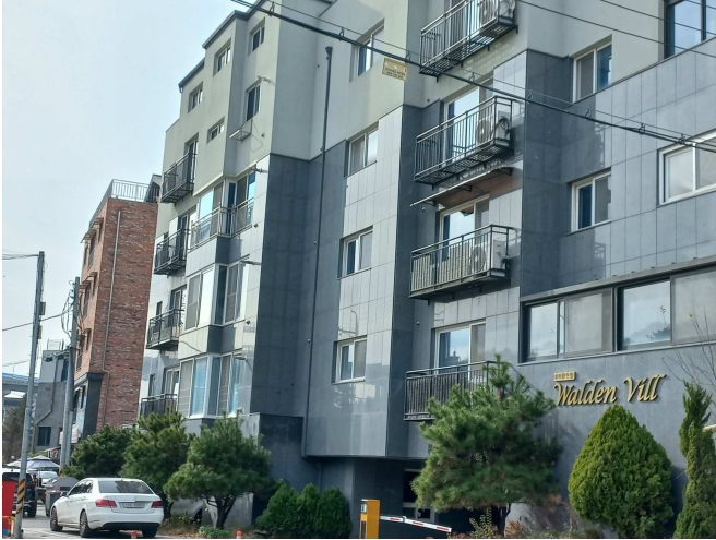
번호가 있는 건물