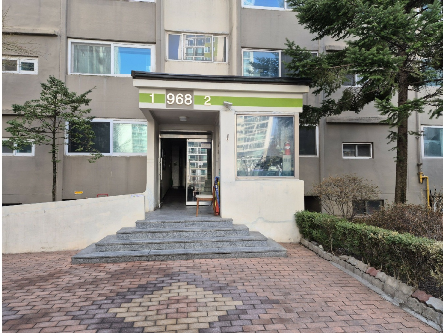
968 1, 2