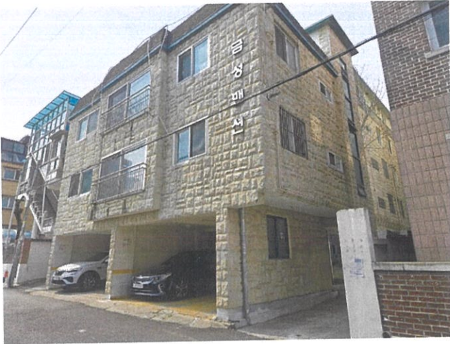
금성맨션 A,B동 전경