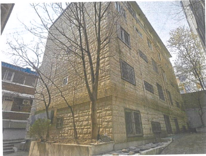
금성맨션 A동 전경