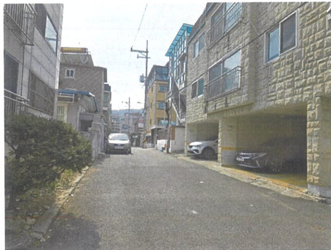
주위환경 - 북동측 도로변