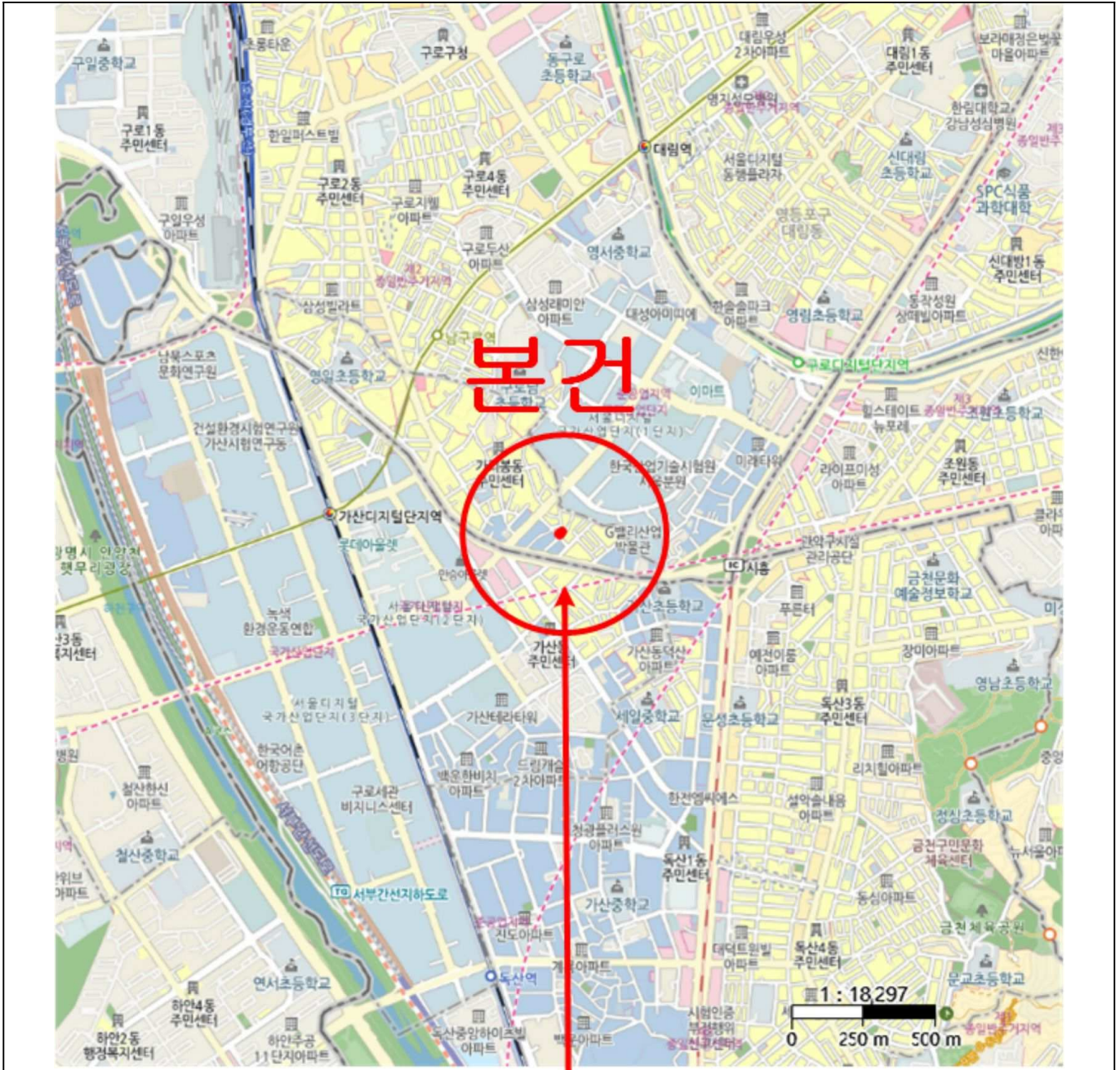
본건(아덴하임 제 3층 제 301호)

소재지 서울특별시 구로구 가리봉동 134-82외 아덴하임 제3층 제301호