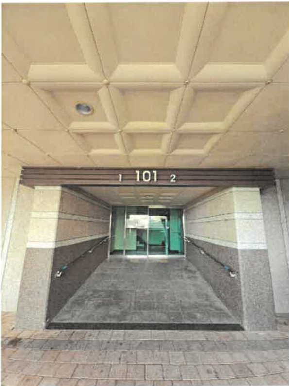
본건 지하1층 출입문