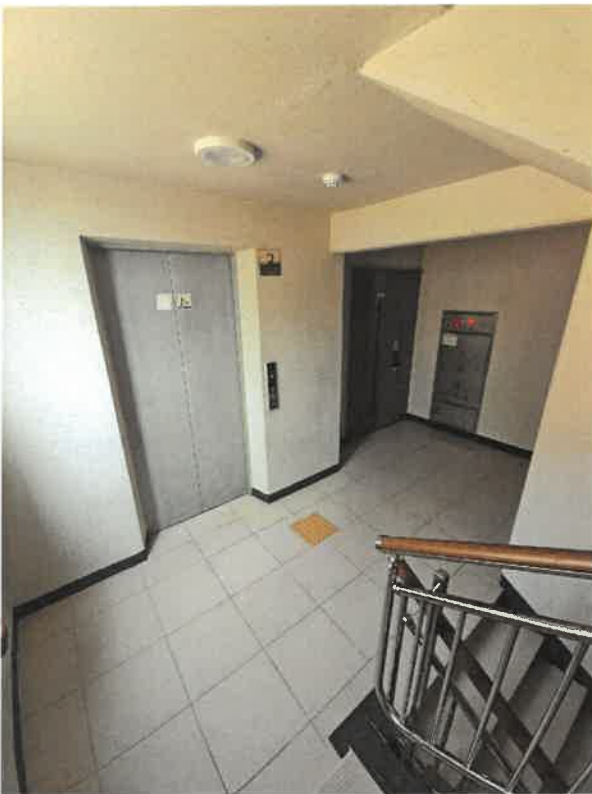
본건 3층 복도