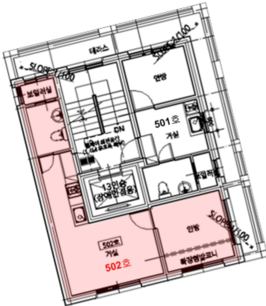
< 더스위트 제5층 제502호 호별배치도 및 내부구조도 >