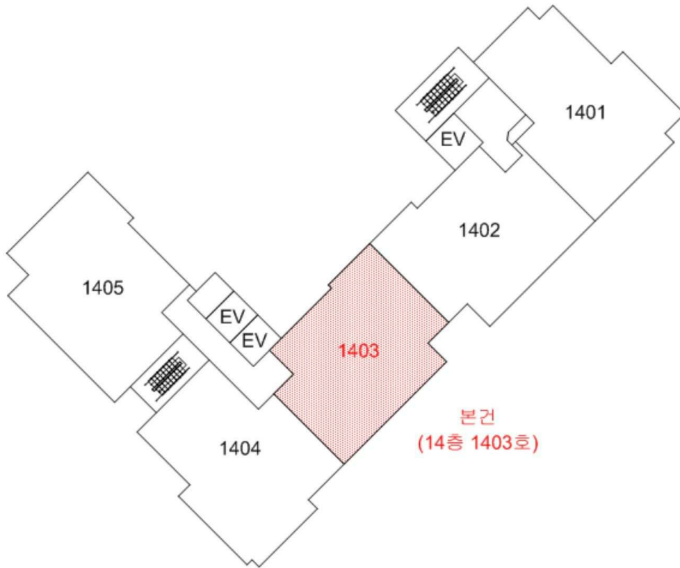
지사과학삼정그린코아 109동 14층 호별배치도