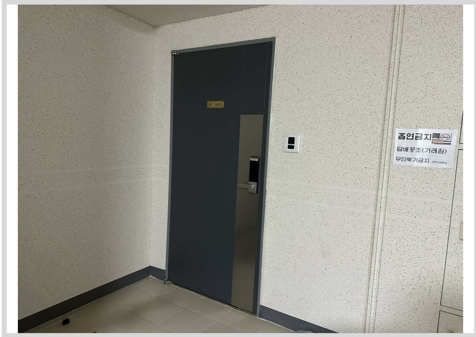
본건 전경(현관 입구)