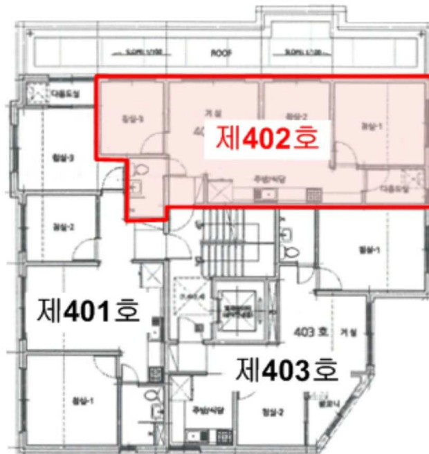
《 석수동 325-10 골든트리 제4층 호별배치도 》