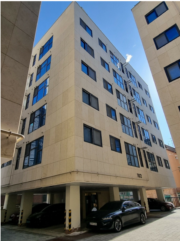
( 102 )