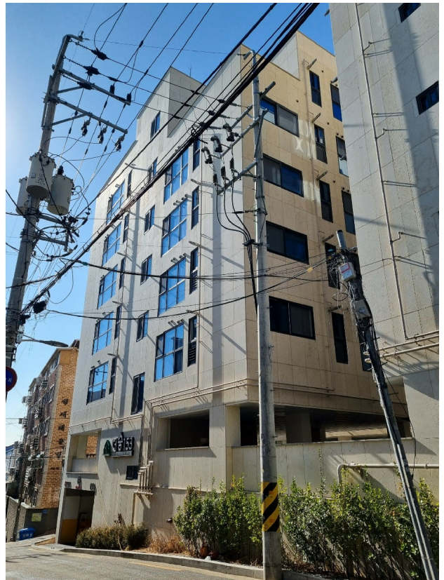
( 102 )