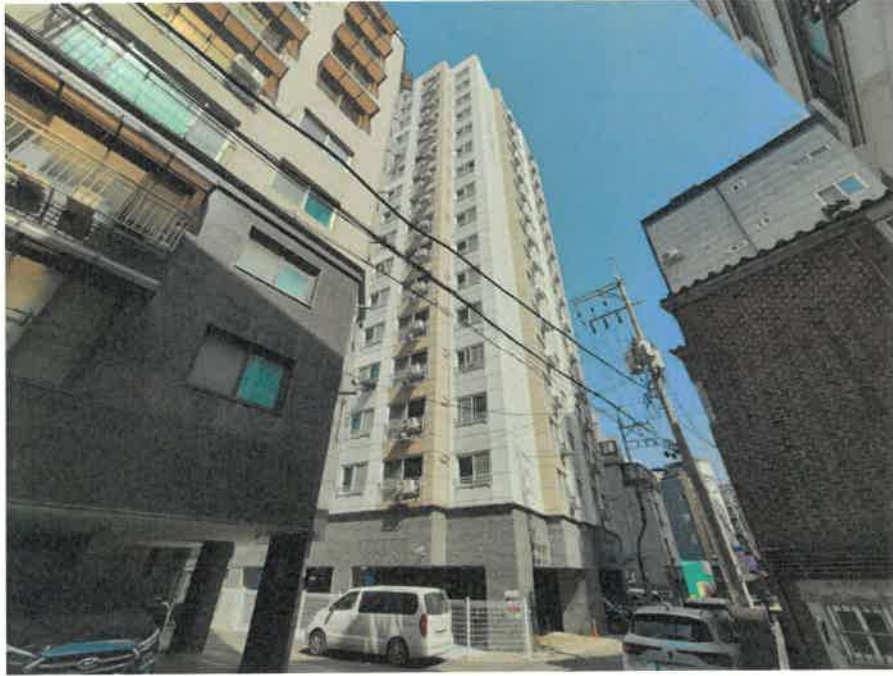
본건 전경(남 측에서 촬영)