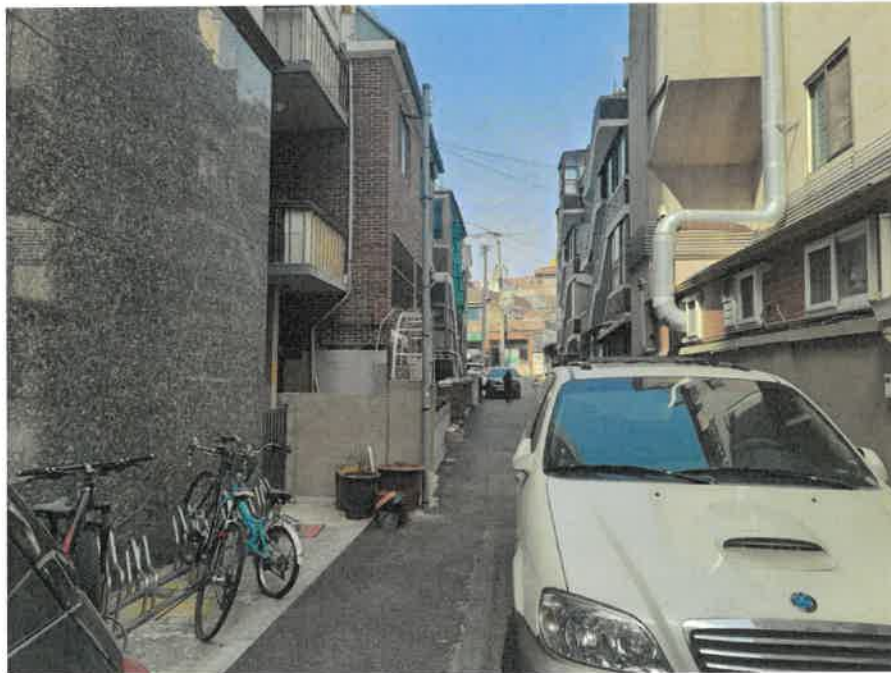
본건 북서측 주변