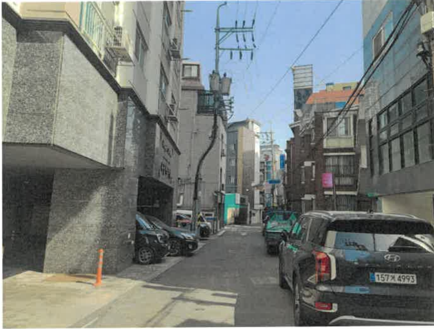
본건 북동측 주변