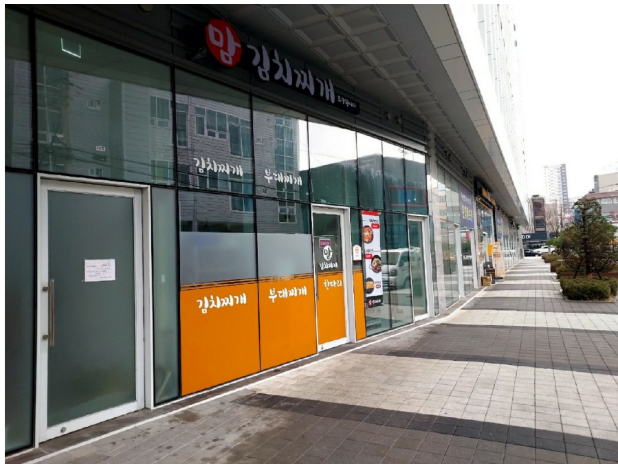
1 125 1