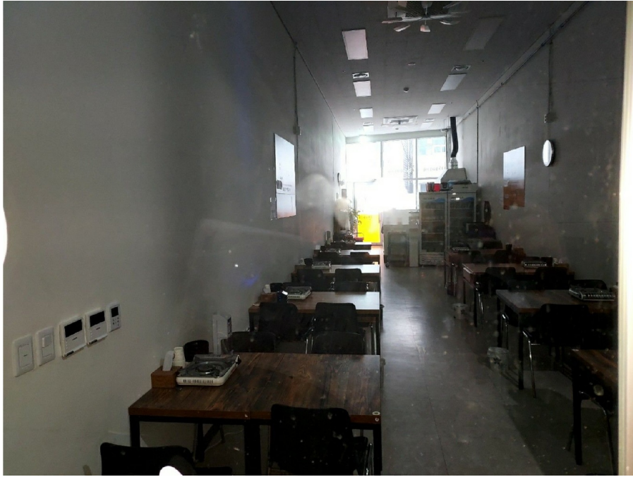
1 125 ( )