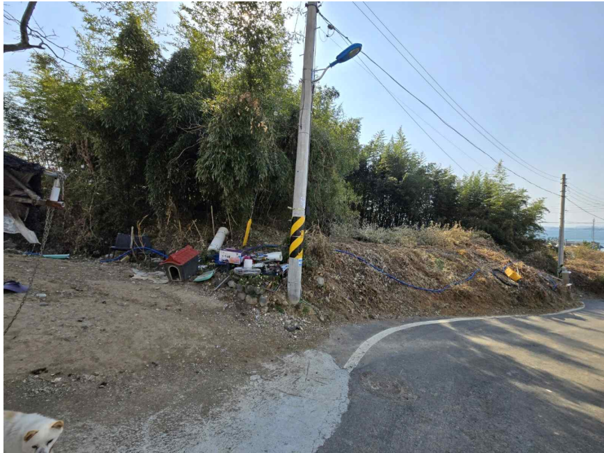
기호(1,2) 남동측 인근에서 촬영