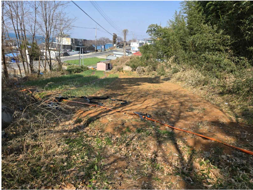
기호(3-6) 남동측 근접촬영