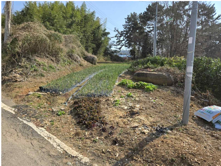
기호(4,6) 북측 근접촬영