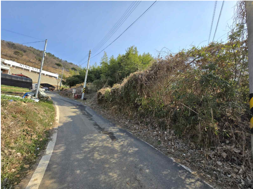
기호(1,2) 북서측 인근에서 촬영