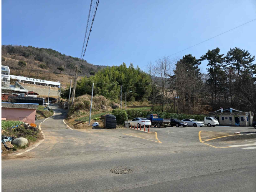
본건 부근 전경사진, 북서측 인근에서 촬영