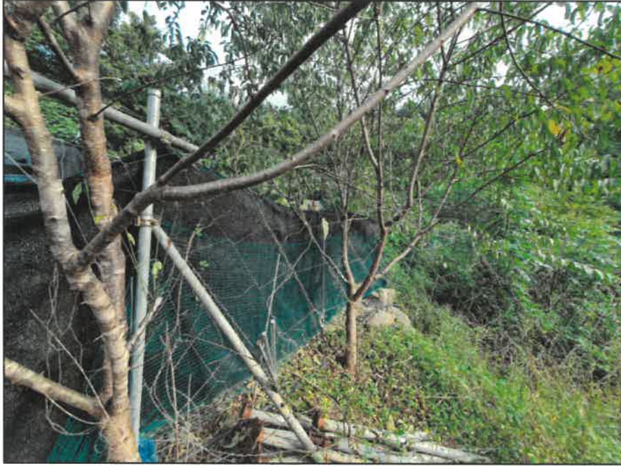
본건 지상소재 파이프조구조물 및 수목 등