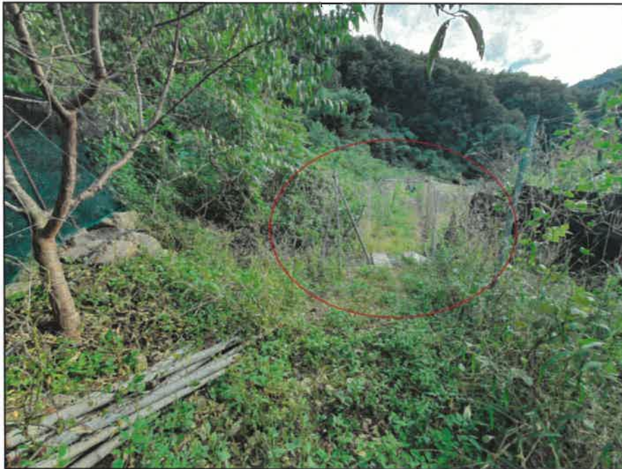
본건 지상소재 배수로 및 파이프조 구조물 등