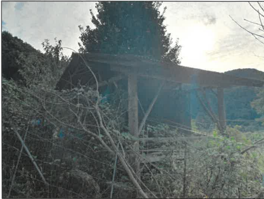
본건 경계지상소재 목조정자