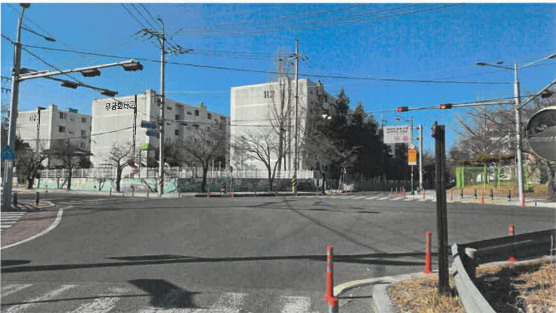
본건 및 주변전경