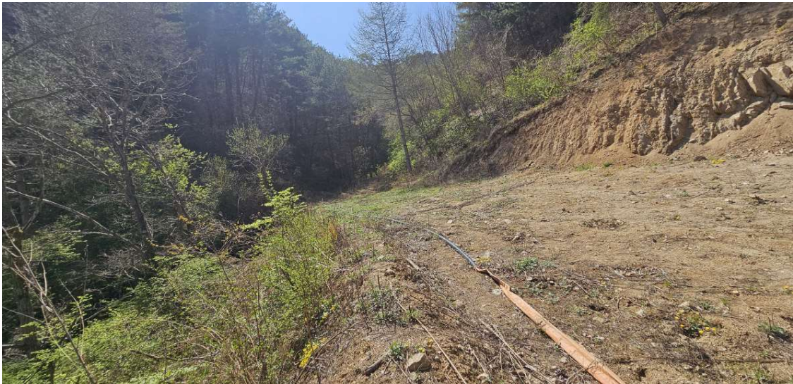
본건 토지 일부 및 인접지 (필요시 측량을 요함.)