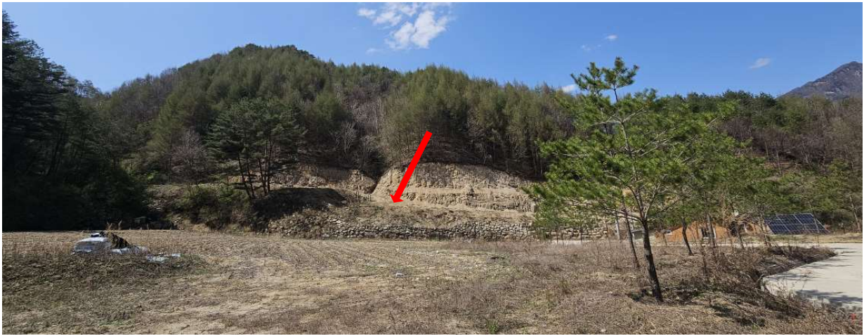
본건 전경 일부 (남측에서 촬영)