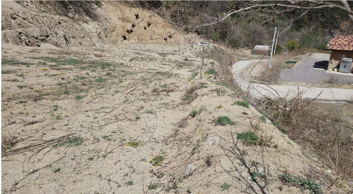
본건 토지 일부