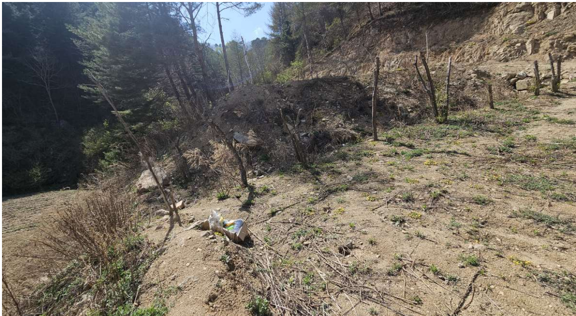
본건 토지 일부