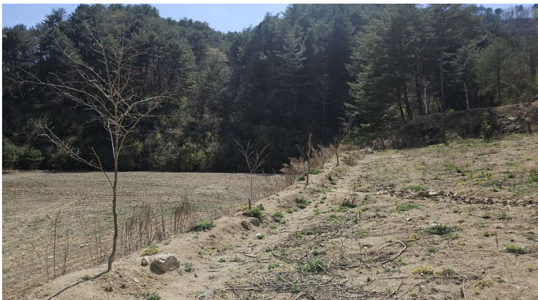
본건 토지 일부