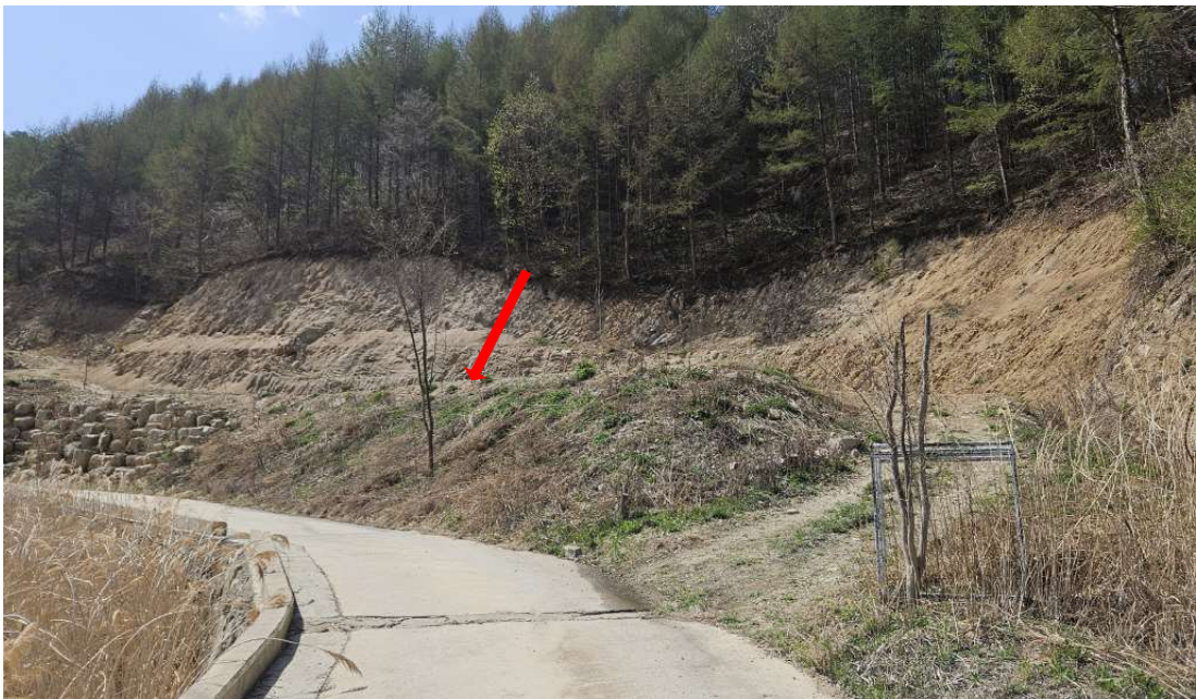
본건 전경 일부 (남동측에서 촬영)