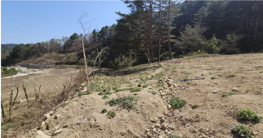
본건 토지 일부