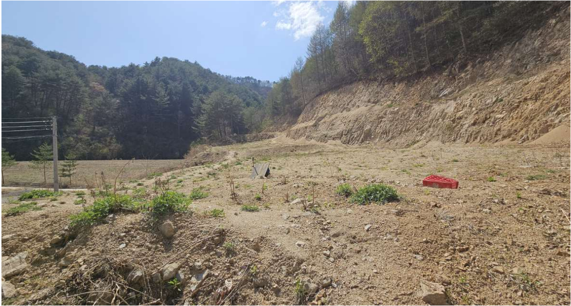
본건 토지 일부