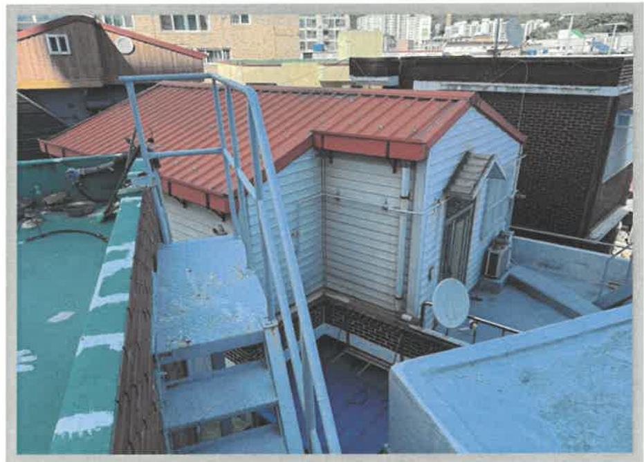
【본건전경】 일련번호(가) 2층