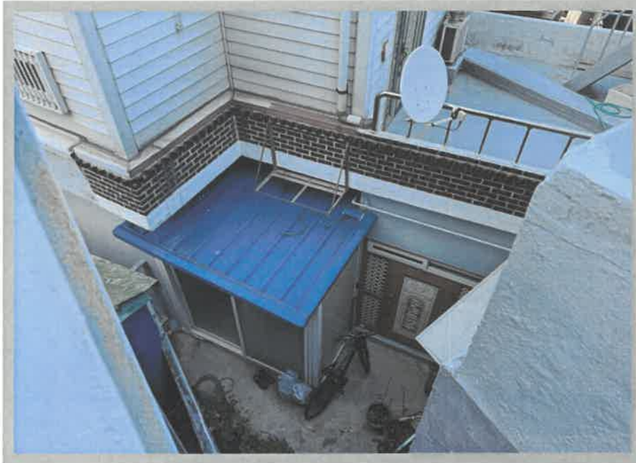
【본건전경】 일련번호(가) 1층 및 제시외건물(ㄱ)