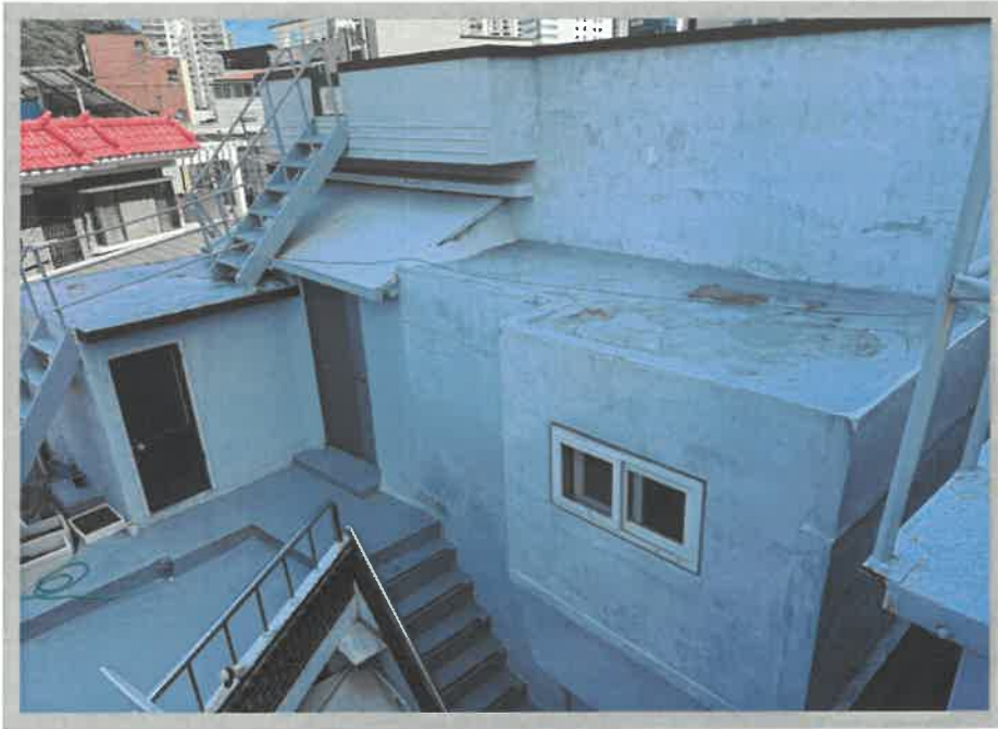
【본건전경】 일련번호(가) 2층 및 제시외건물(ㄷ)