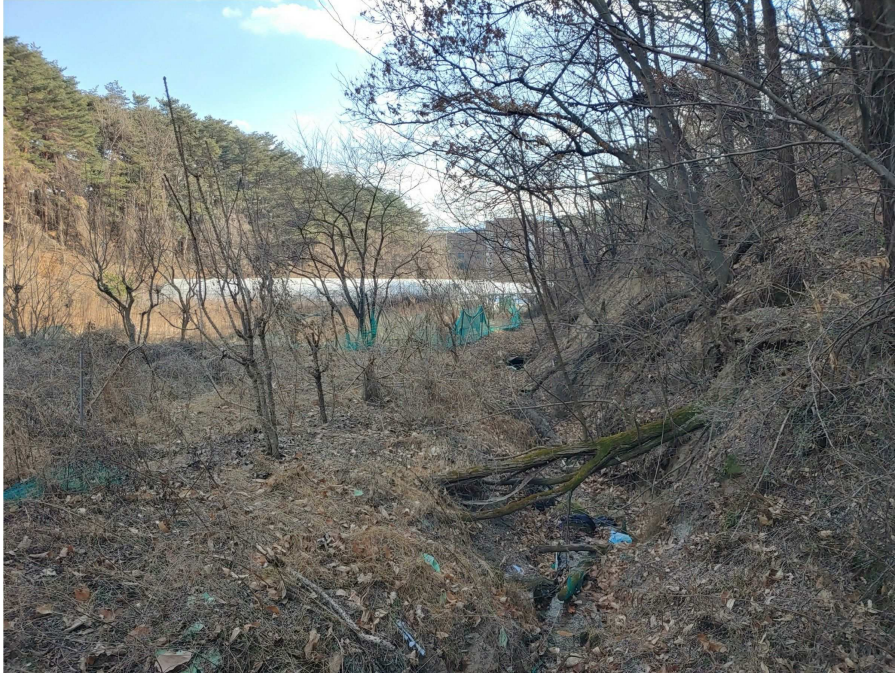
서측 구거(배수로) 및 경계 전경(정확한 사항은 측량 등 필요)