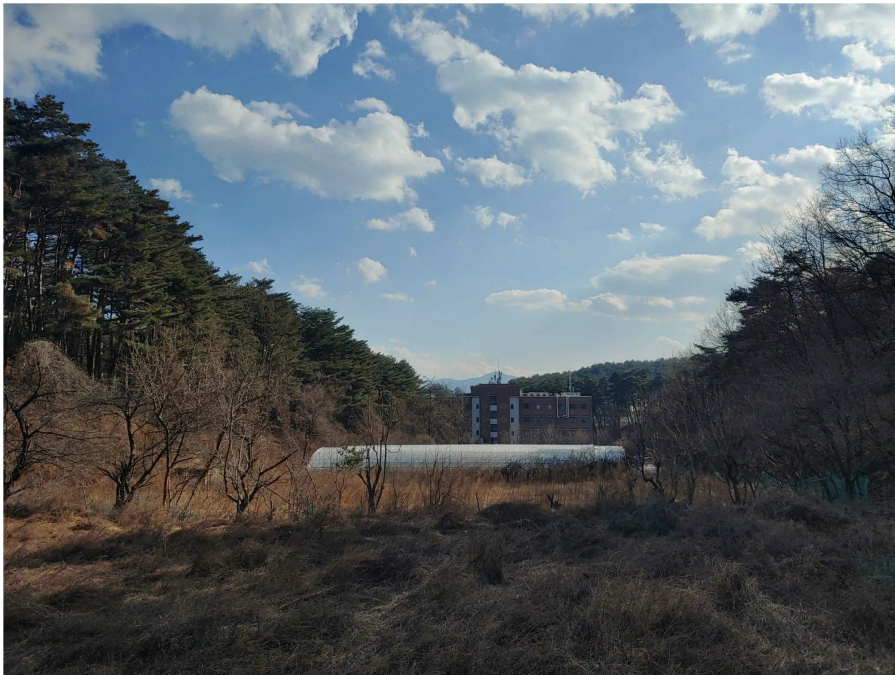
인근 전경(남측 대학교 방향)