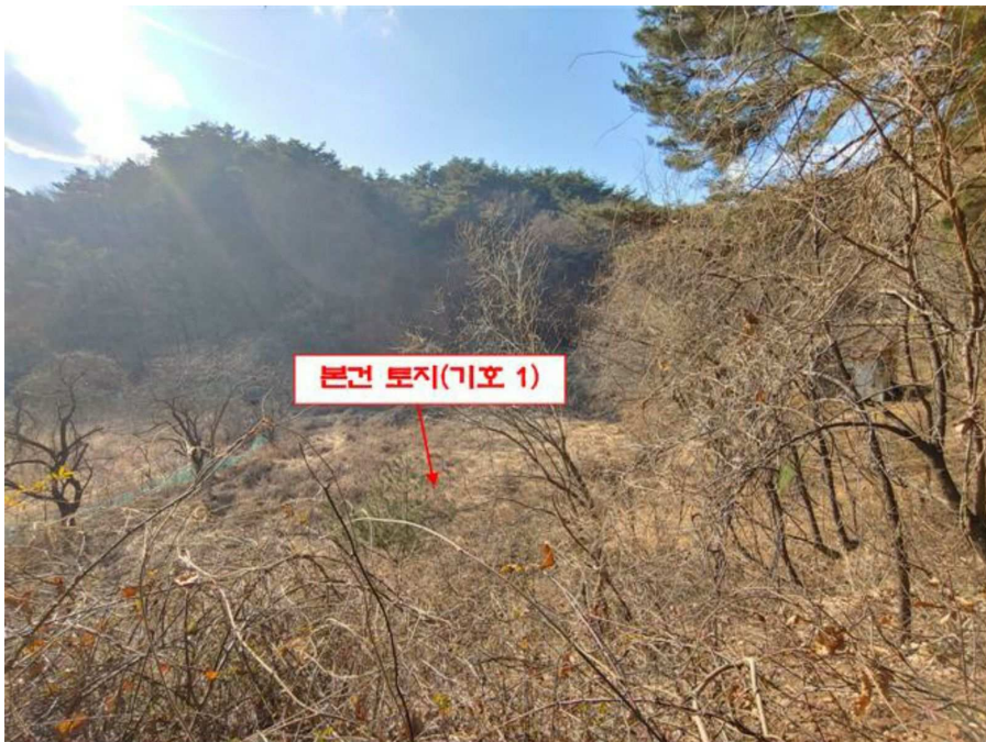
본건 전경(기호 1)