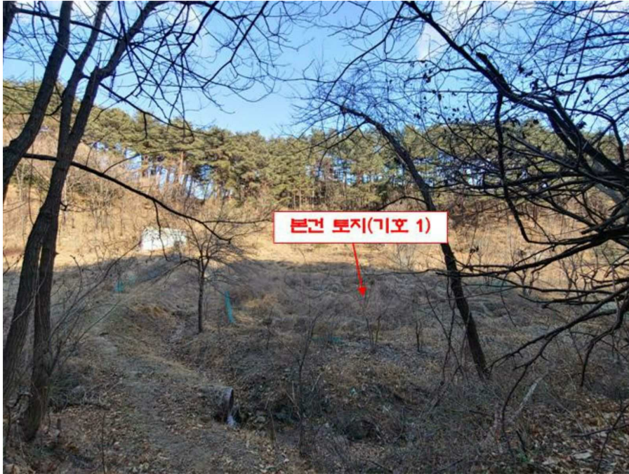
본건 전경(기호 1)