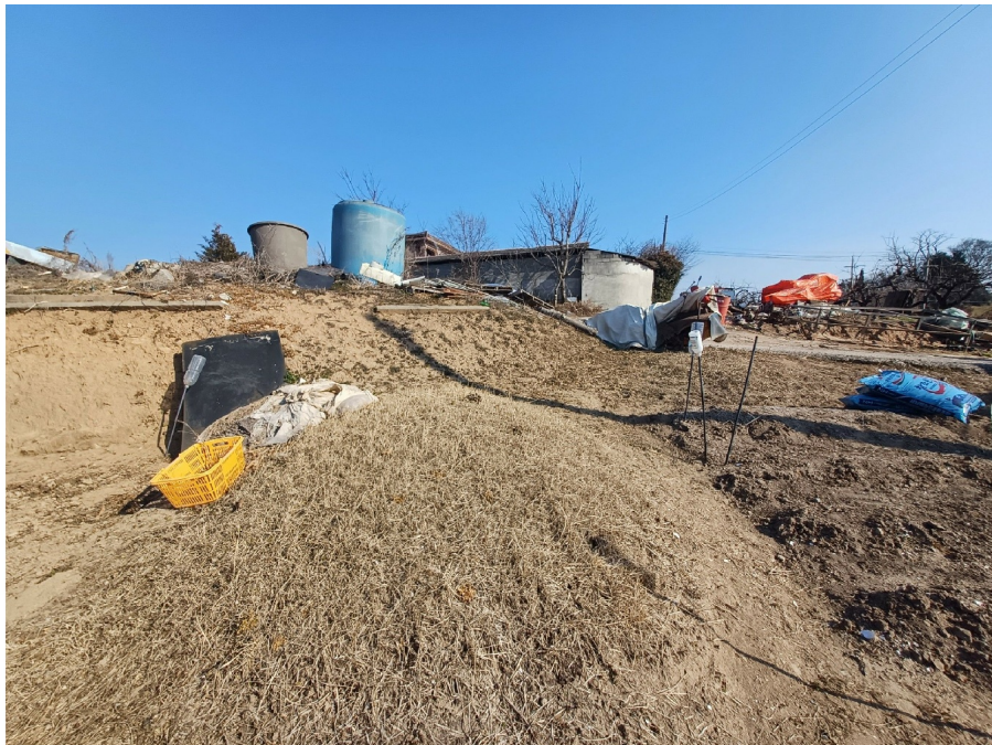
(1) ( 650 )