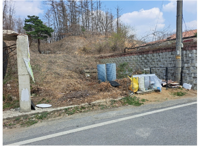
1, 2( 2)