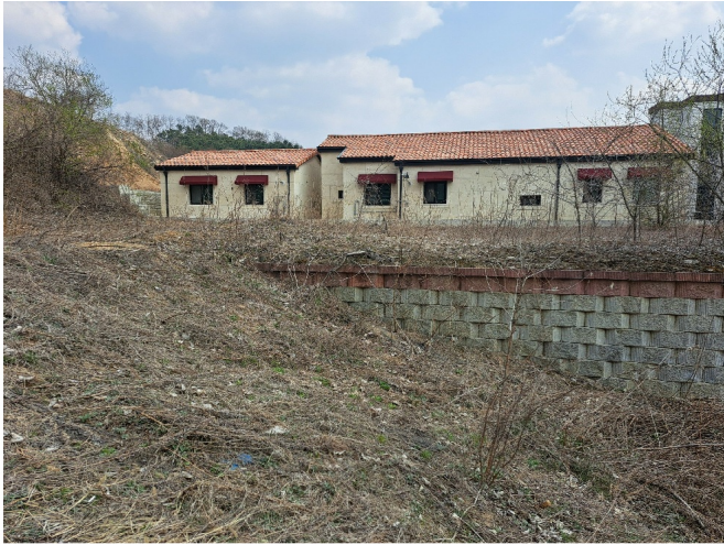
1, 2( 1)