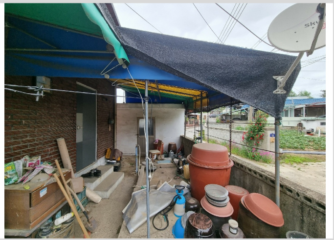
1 ( )