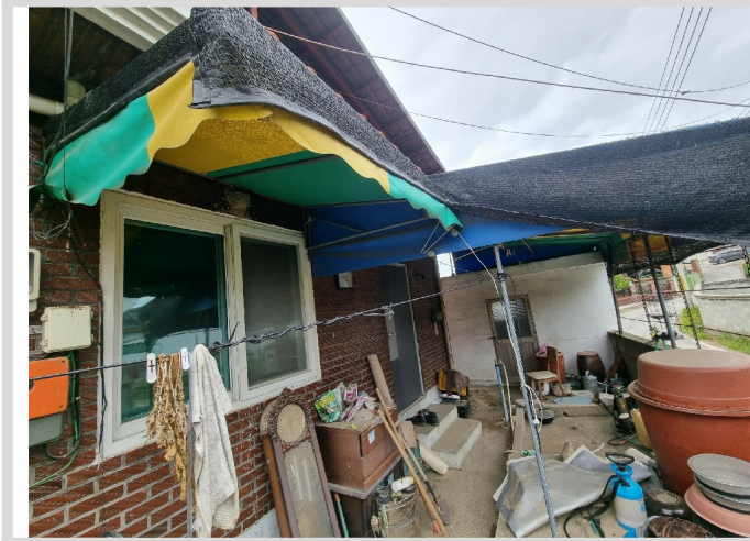
1 ( )