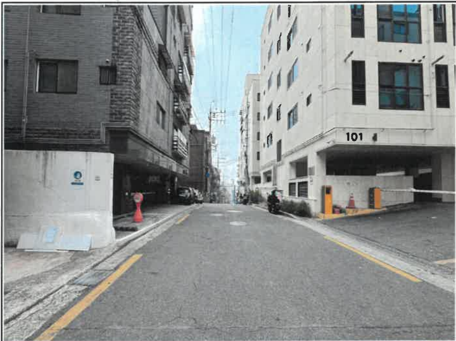
대상물건이 속한 단지 주위환경