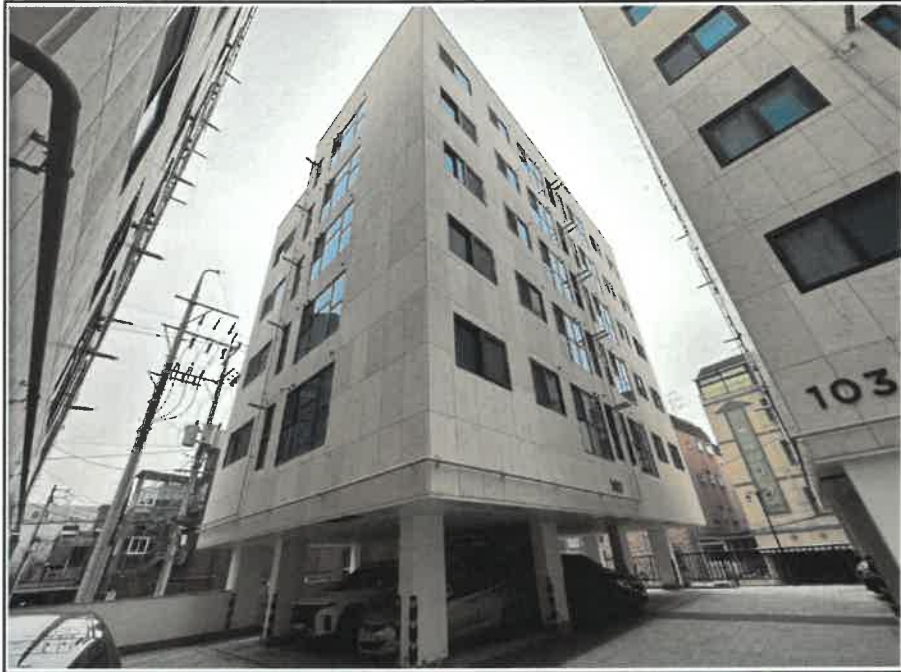
대상물건이 속한 건물 전경