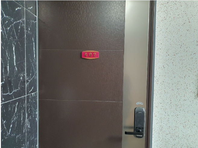
( 402 )