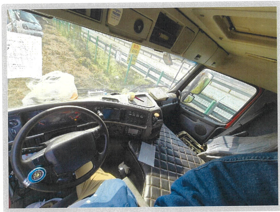
【 본건 내부 】