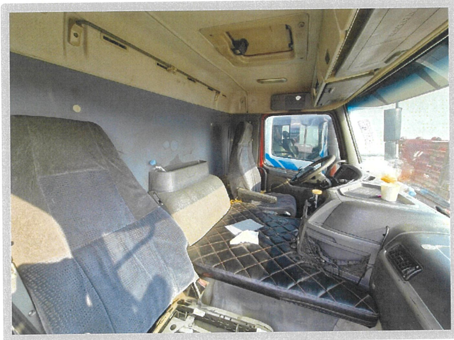
【 본건 내부 】