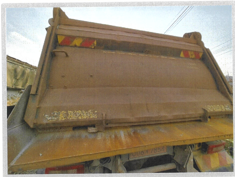
【 본건 전경 】