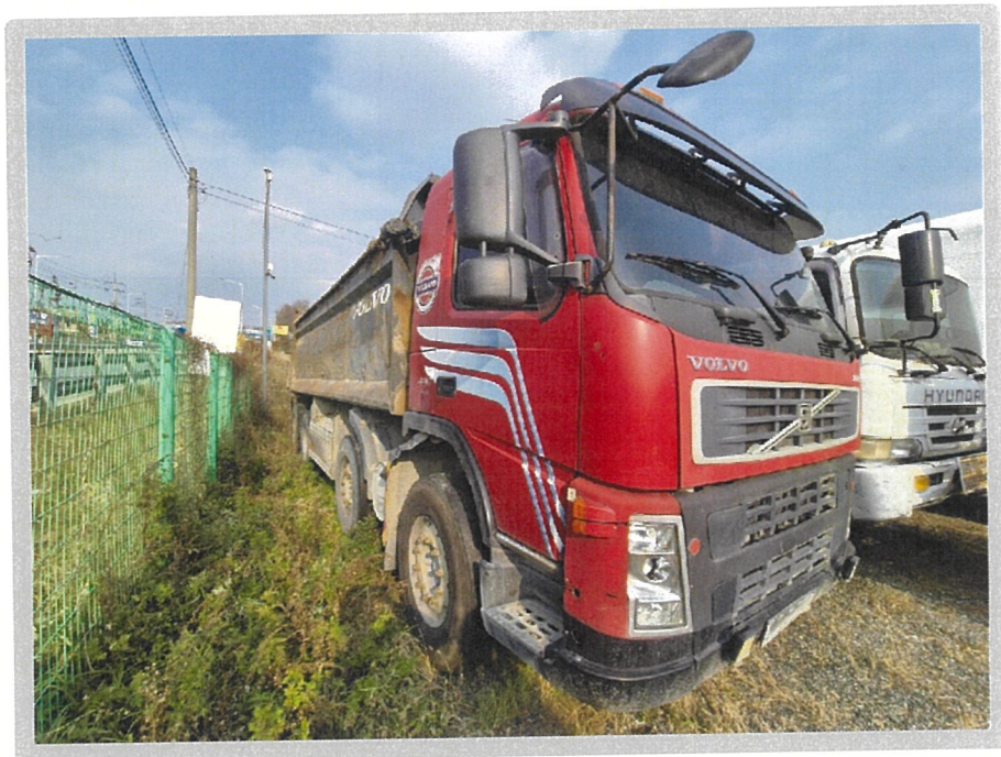
【 본건 전경 】