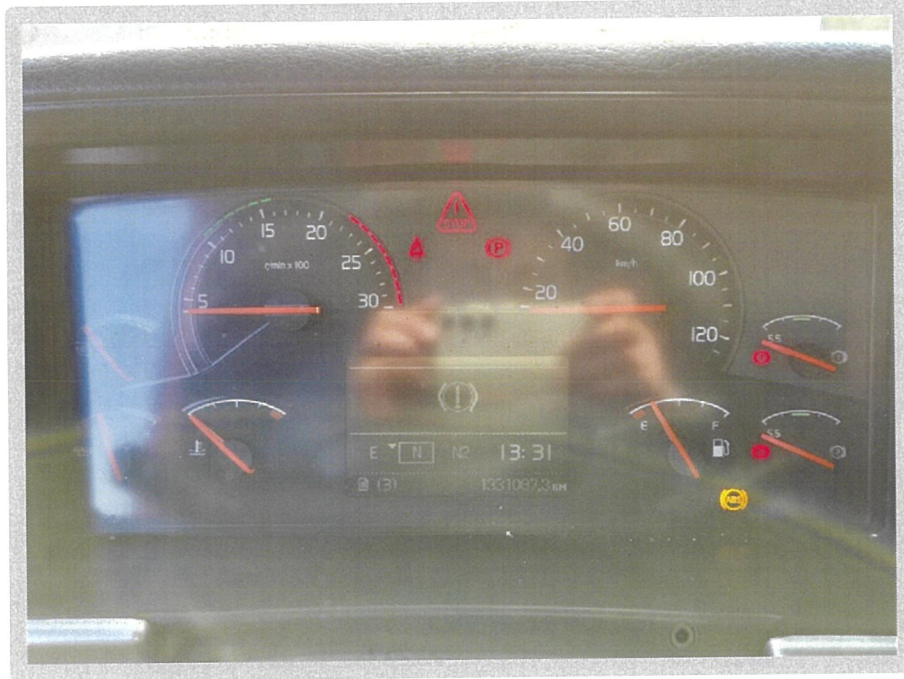
【 본건 계기판 】