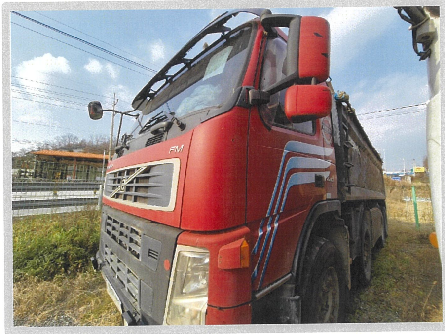
【 본건 전경 】