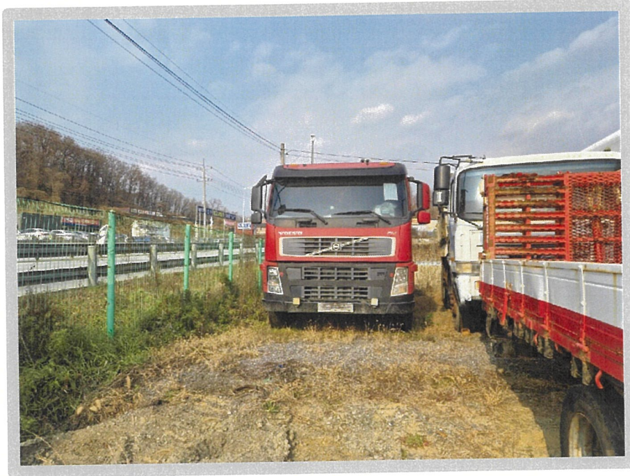
【 본건 전경 】