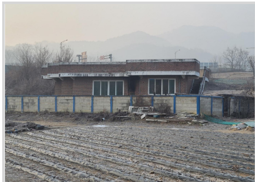
본건 지상 제시외물건 사진