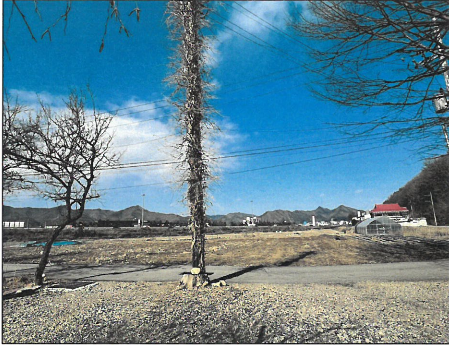
【 기호(1) 】