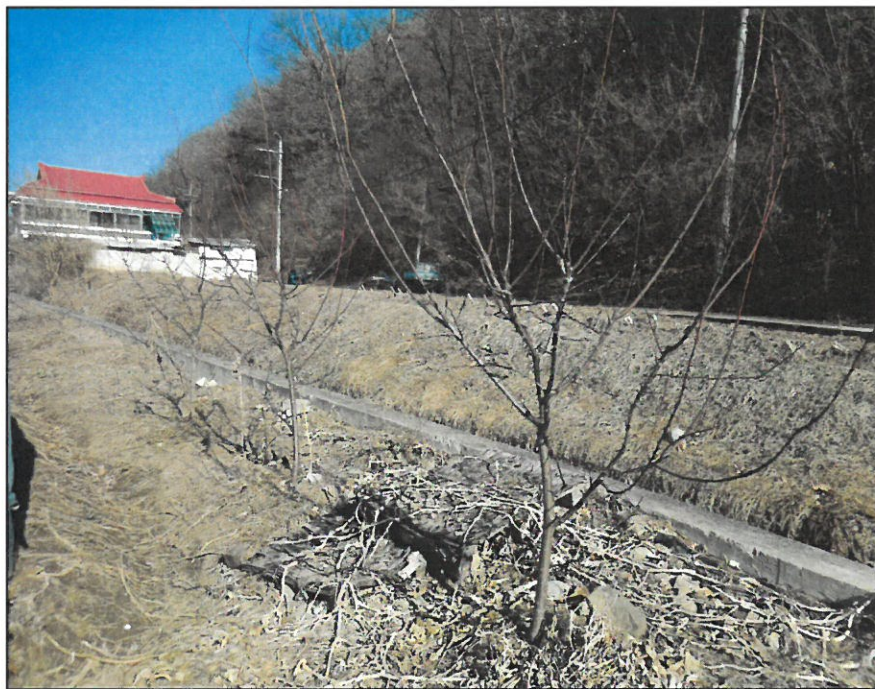
【 본건 경계부근 평가제외 수목 】