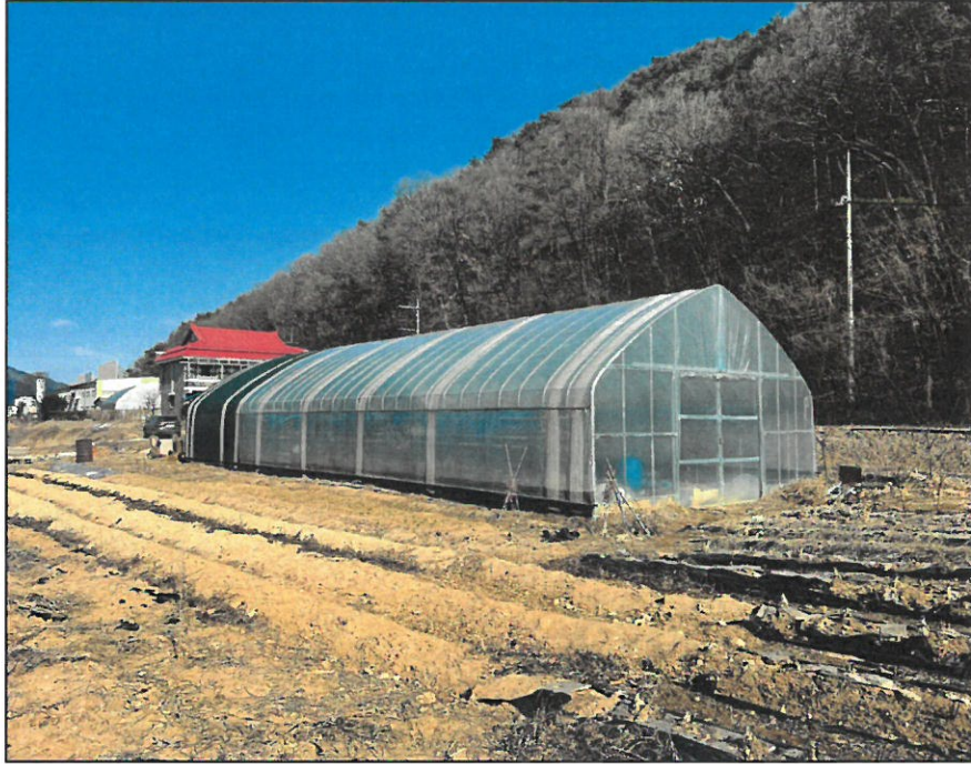
【 기호(2)일부지상의 평가제외 제시외 비닐하우스 】