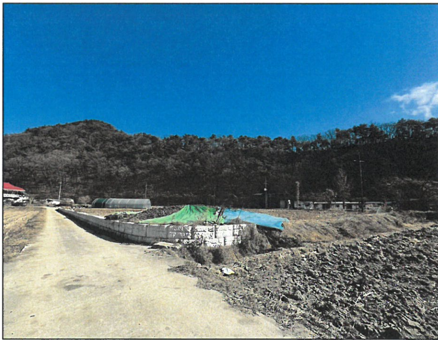
【 기호(2) 】