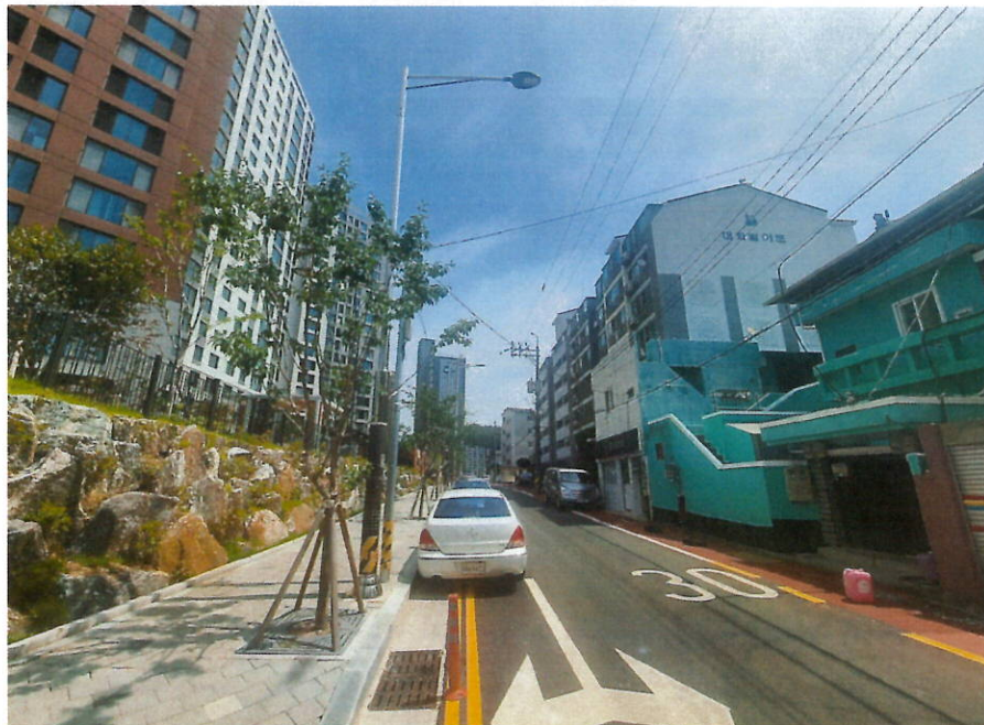
본건 및 주변환경