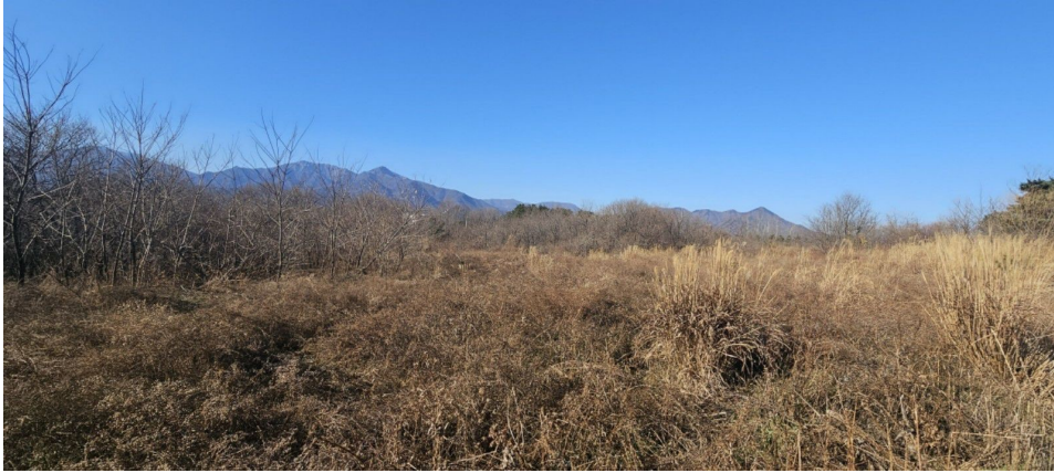
본건 일부 전경 및 인근환경 (동측에서 촬영)