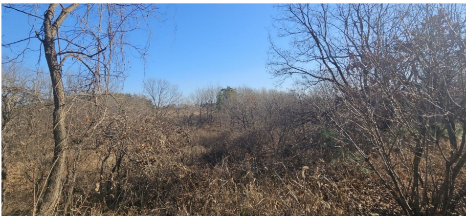
본건 일부 전경 및 인근환경 (서측에서 촬영, 경계불분명으로 필요시 측량을 요함.)