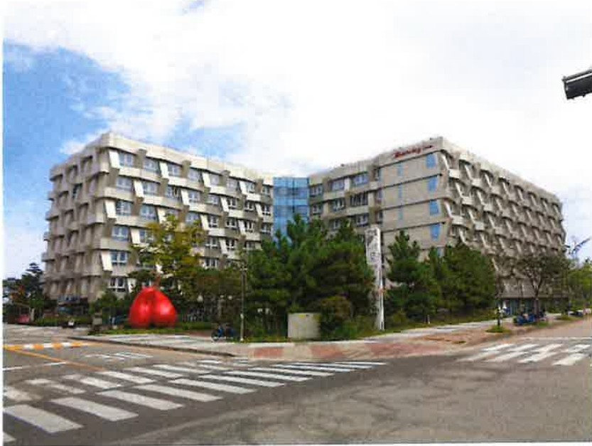
본건내 4층 449호