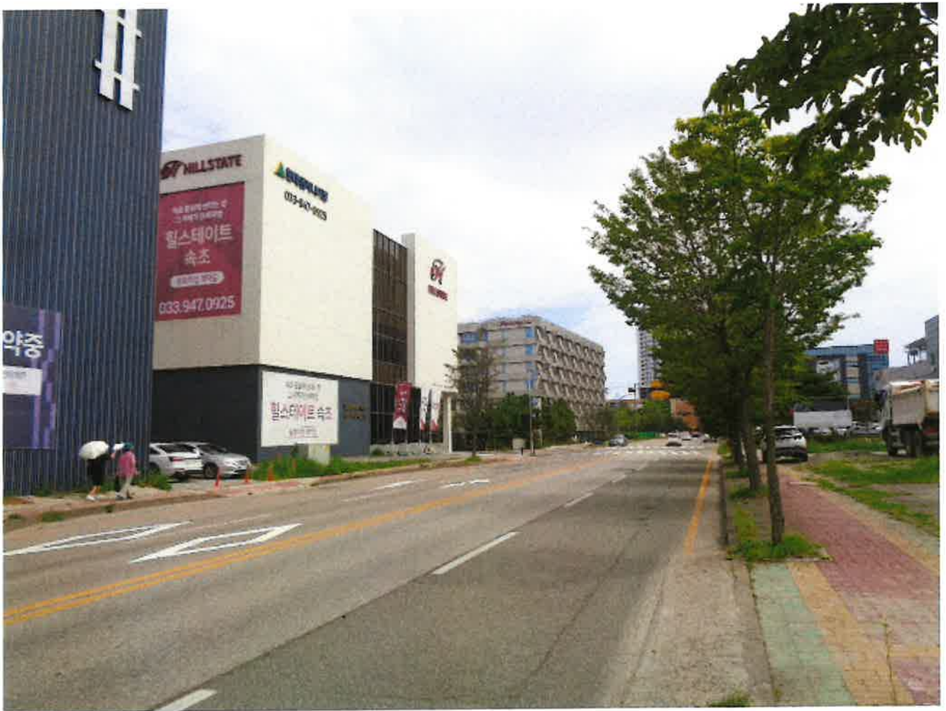
주 위 환 경