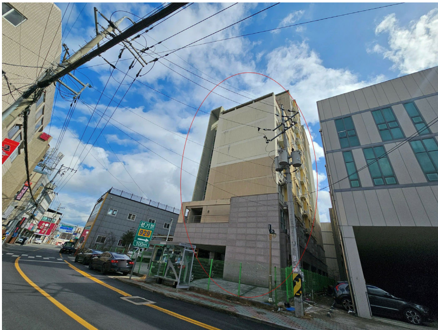
본건동 전경(서측에서 촬영)