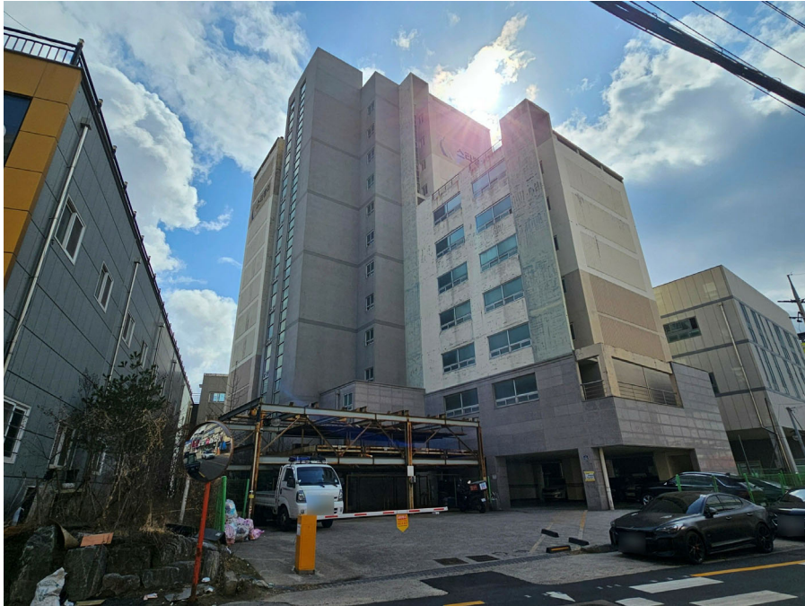
본건동 전경(북서측에서 촬영)