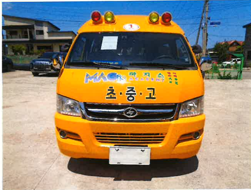
본 건 전 면