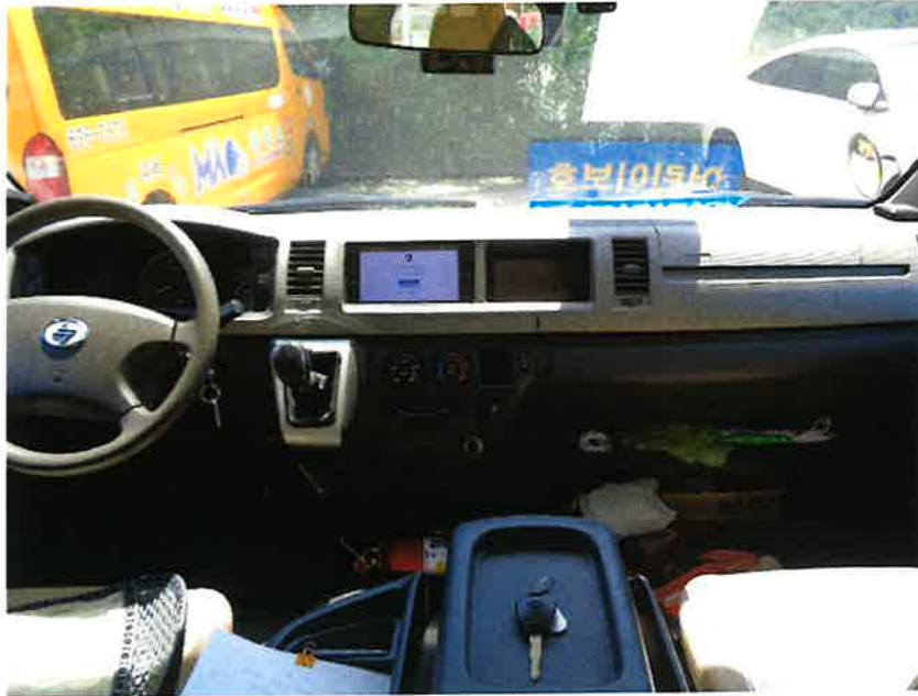
본 건 내 부