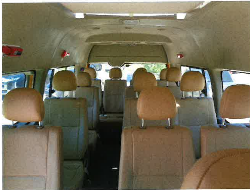
본 건 내 부