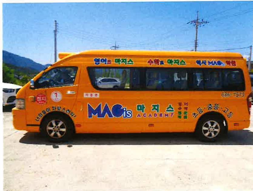
본 건 측 면