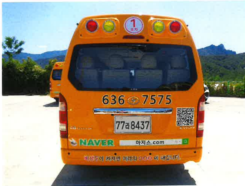
본 건 후 면