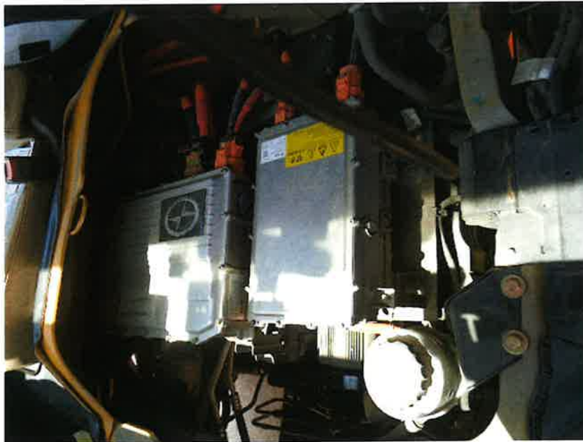
배 터 리