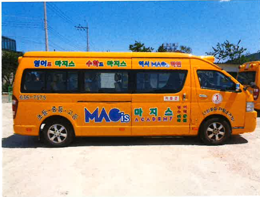
본 건 측 면