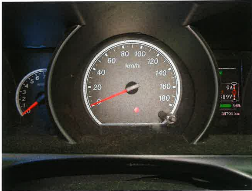
계 기 판