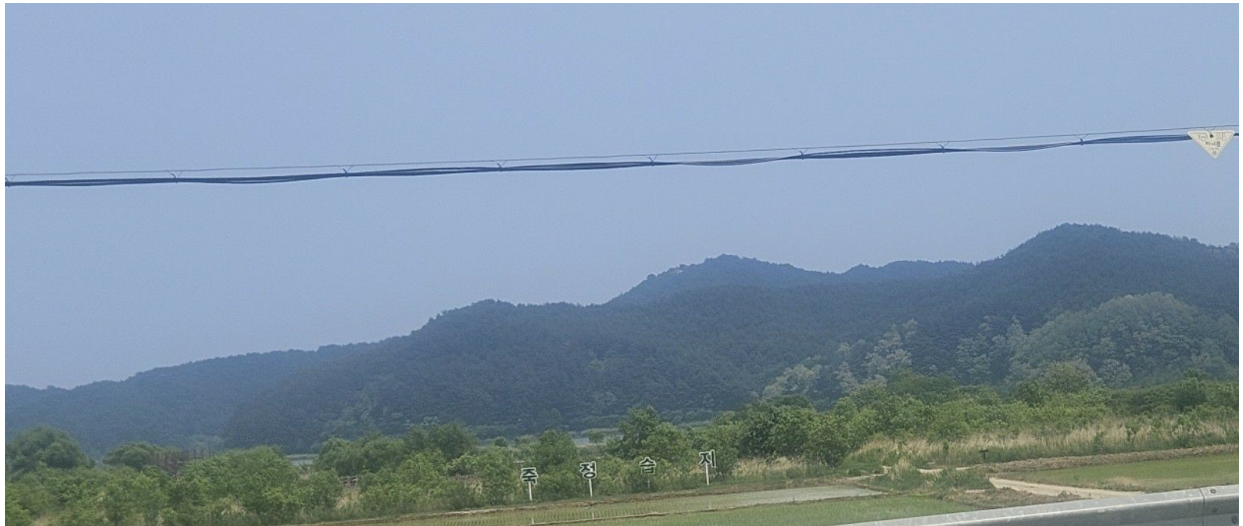
본건 원거리 전경 (서측에서 촬영)