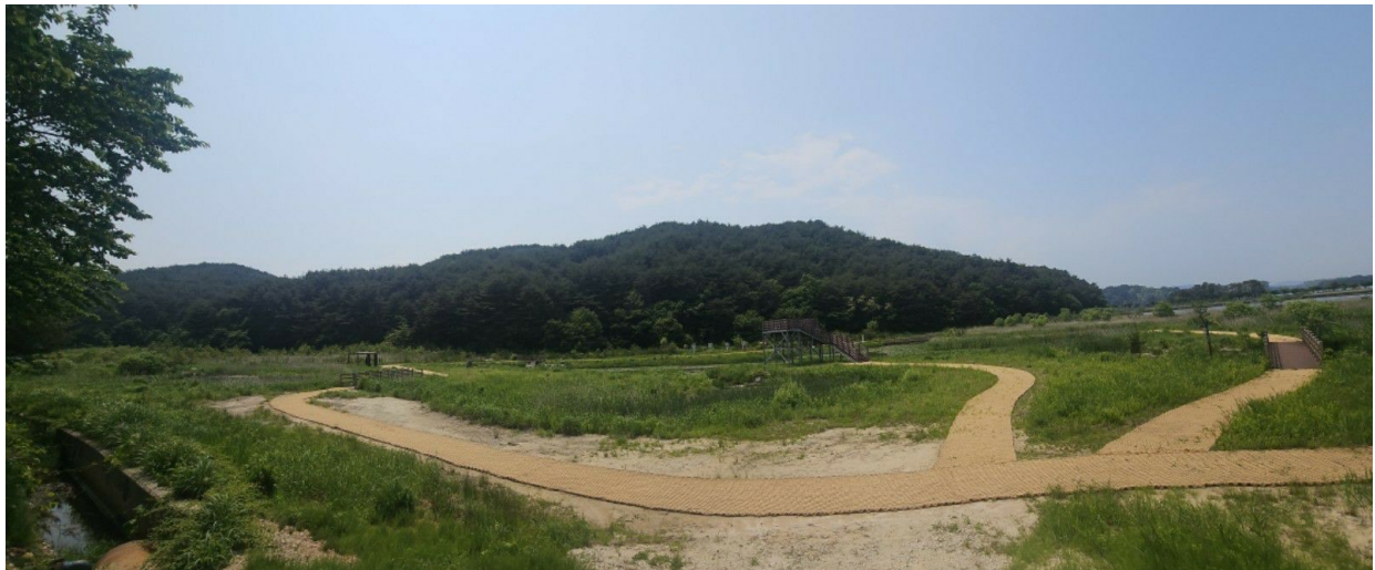
본건 원거리 전경 (동측에서 촬영)