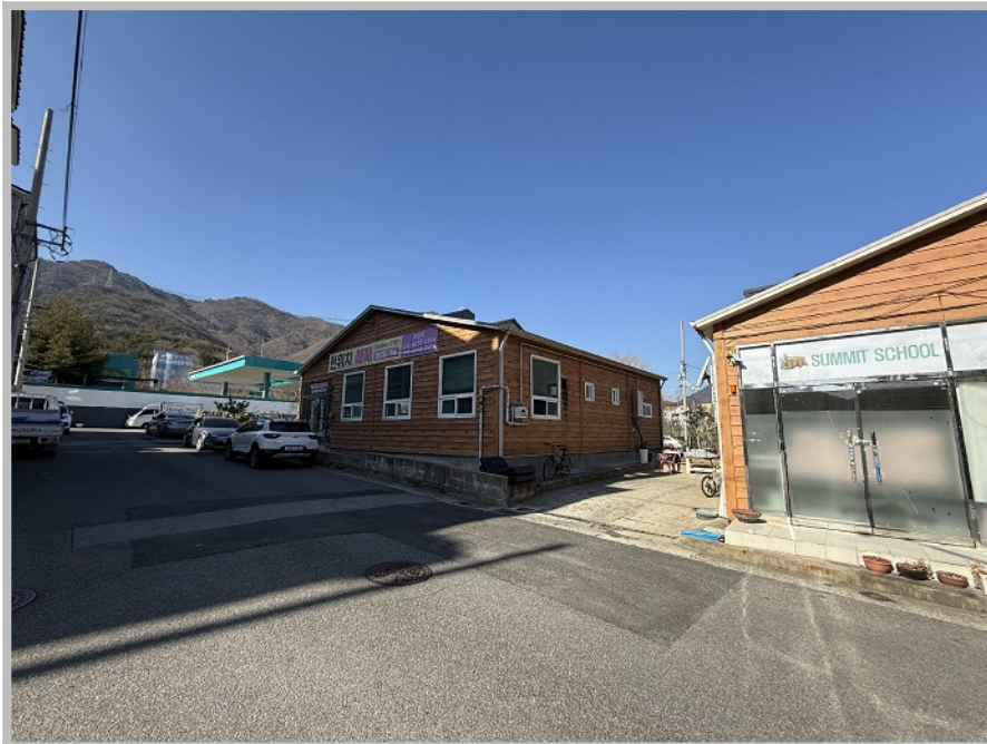
【 본건 전경 】