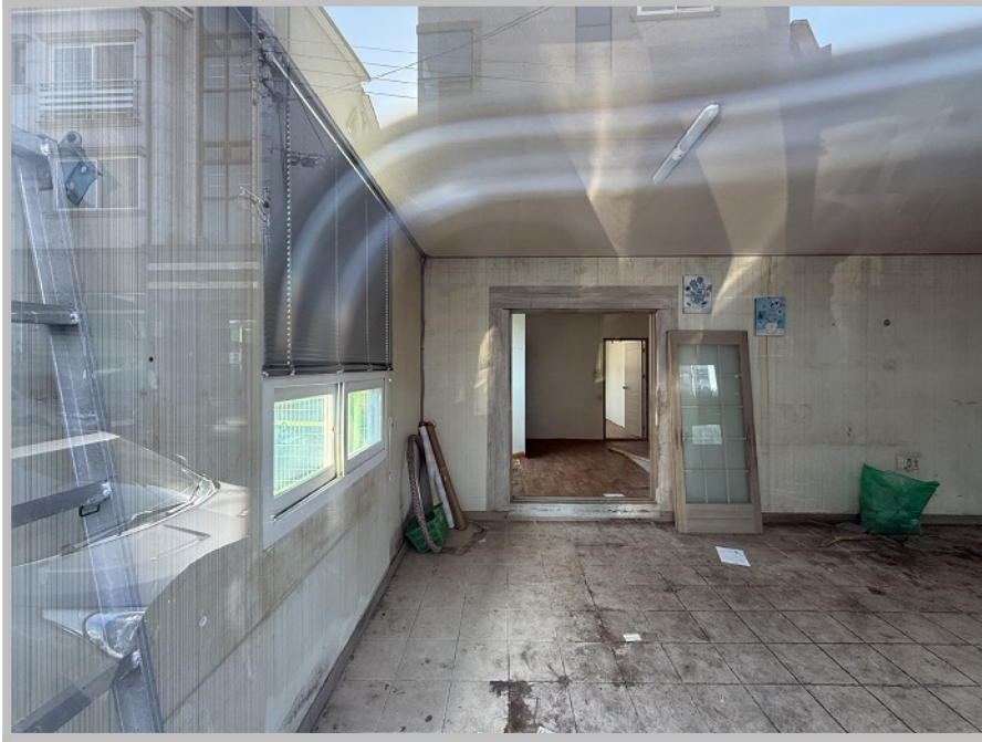
【 본건 내부 】