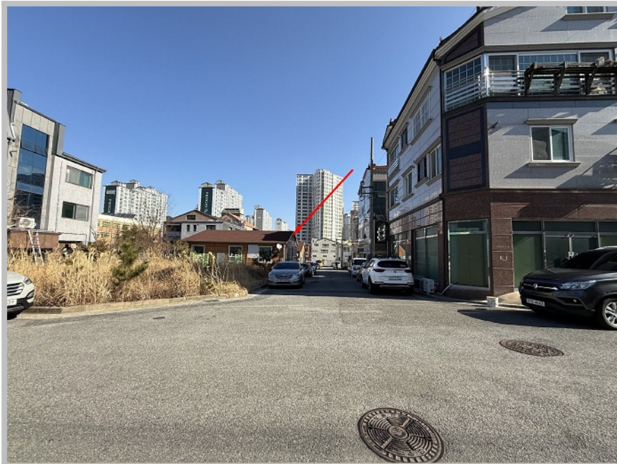
【 주위 환경 】