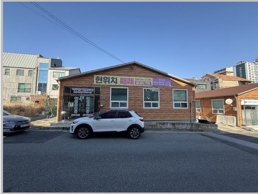
【 본건 전경 】