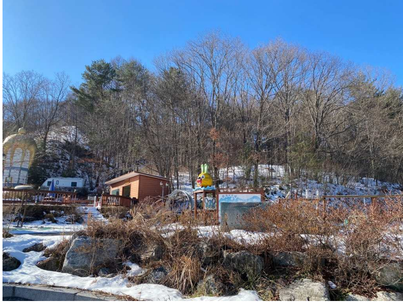
본건 전경 및 주위환경