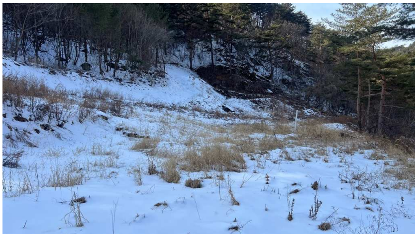
본건(2) 남동측 전경