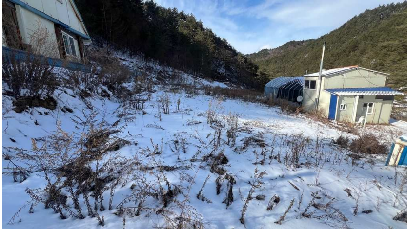
본건(1) 남동측 전경